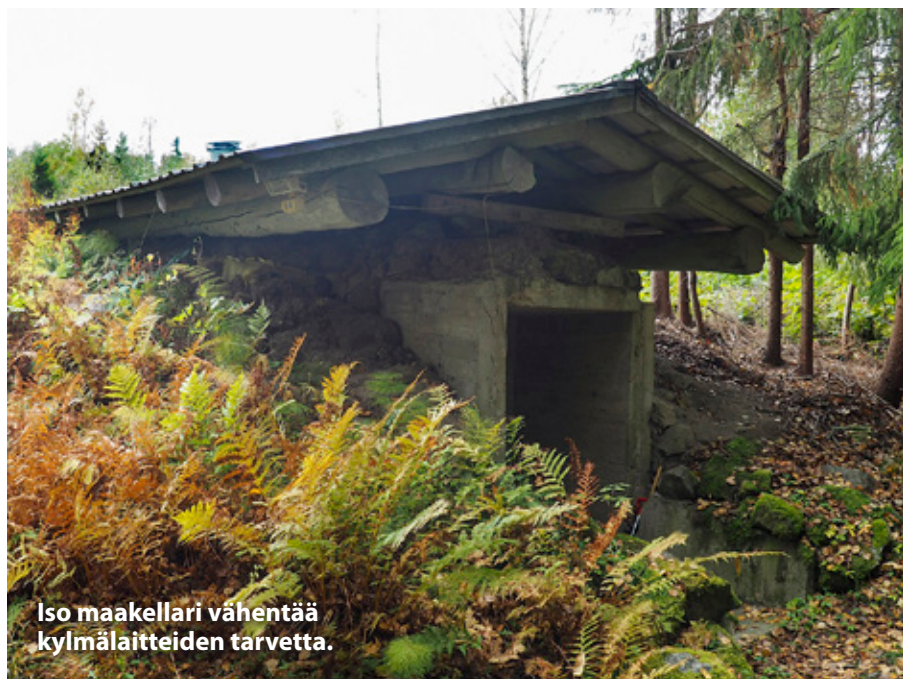
Iso maakellari vähentää kylmälaitteiden tarvetta.