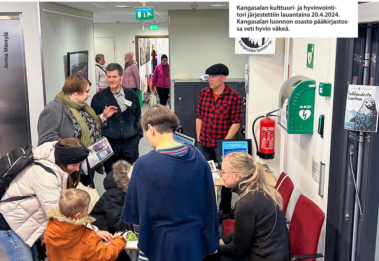
Kangasalan kulttuuri- ja hyvinvointitori järjestettiin lauantaina 20.4.2024. Kangasalan luonnon osasto pääkirjastossa veti hyvin väkeä.