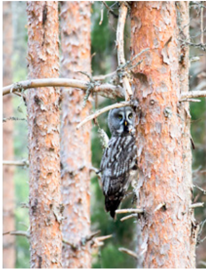
Lapinpöllö keväällä 2023.