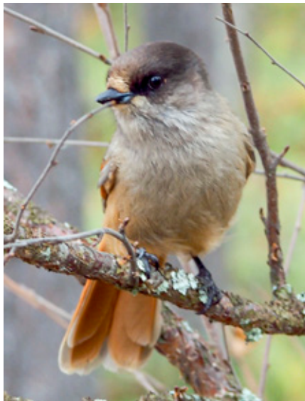
Kangasalan viimeinen kuukkelihavainto on Rajalan kämpän liepeiltä vuodelta 1999.

– Kivitasku on myös oma suosikki kirjoistani. Se on yritys lisätä ymmärrystä kallioperää ja kiviä kohtaan, jotka myös monet luontoihmiset saattaa vähän ohittaa. Kivet ja kalliot ovat elotonta materiaa, eikä niitä ole arvoitettu, mutta itse olen lapsesta asti ollut hyvin viehättyynyt kivistä, mykästä voimasta, mikä niihin tuntuu kätkeytyvän. Olen myös miettinyt paljon Suomen vanhoja sananlaskuja, kuten ”luottaa kuin kallioon” ja ”olla vuorevarma”. Eli me ollaan mielletty kalliot ikuisuuden symbolina ja kuitenkin nykyään kallioita louhitaan todella paljon ja hyvinkin lyhytaikaisesti hyödyntämiskohteisiin. Tuntuu, että me murennamme