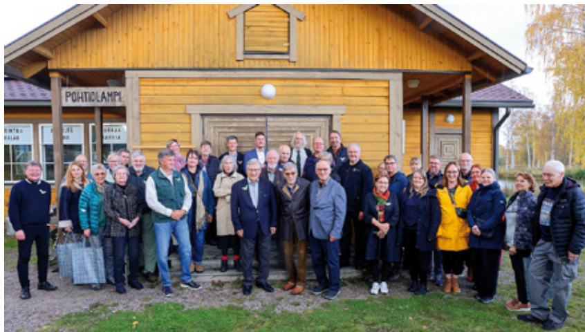
Sääksikeskuksen lopettajaiset Pohtiolammella 12.10.2024.

Retken loppupäässä Viitastenperän hobitinkoloa muistuttavalla laavulla nautittiin vielä yhdessä nuotiotulesta, luonnon rauhasta sekä tietysti tärkeimmästä eli eväistä. Levähdys hetken jälkeen reippaimmat suuntasivat vielä Makkarajärven rantojen kautta samaa reittiä takaisin kohti Kangasalaa. Joukkion erotessa joku huikkasi vielä: "Tämä oli hieno retki, ensi vuonna uudestaan!" Toivottavasti ensi vuonna ja tulevina vuosina vielä sen jälkeenkin tämä reitti säilyisi luonnonmukaisena ja sitä saisivat edelleen kulkea pienet tassut, loikkivat räpylät, lonksuvat kumisaappaat ja miksei vaikka keissuja vetävä hevonen. □