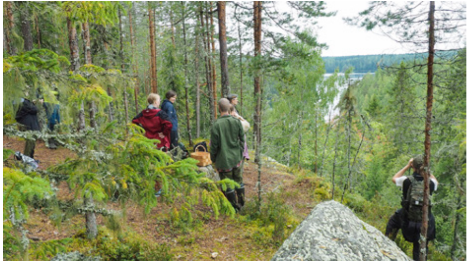
Korppivuorelta bongattiin kalasääsken pesä.

Suomen luonnon päivä on luonnon juhlapäivä elokuun viimeisenä lauantaina. Sen tarkoituksena on koota suomalaisia yhteen juhlistamaan ja arvostamaan Suomen luontoa. Päivää on vietetty vuodesta 2013 ja vuodesta 2017 sisäministeriö on suosittanut liputusta sen kunniaksi. □