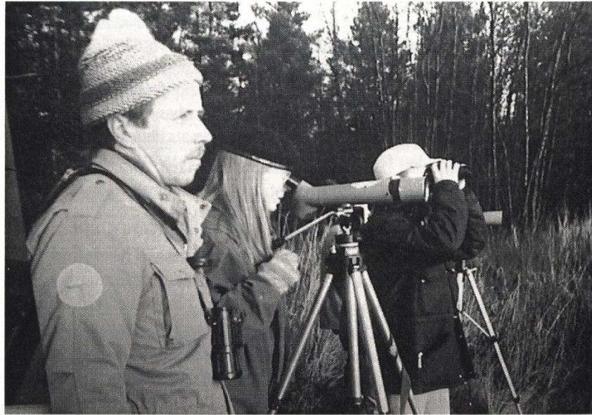
Linturetket ovat olleet keskeinen osa ympäristöyhdistyksen yleisötoiminnasta. Hankoniemi 1991.

Fredning av urskogen vid Mariefred har genomgått många skeden, för det finns i kommunen instanser, som vill erhålla hyggesinkomster från skogen; å andra sidan finns det instanser, som vill att skogen förblir i sitt nuvarande friluft- och rekreationbruk samt förblir skyddad från hyggen. Tillsvidare har den sistnämnda linjen varit förhärskande och skogen står orörd. Föreningen har på många sätt tagit del i främjandet av fredningen och mångbruket ända från år 1985. Området fredades slutligen vår 2000.