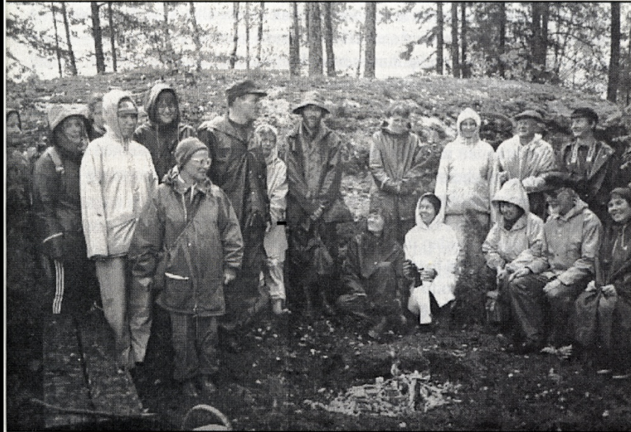
Ympäristöyhdistyksen järjestämä yleisöretki 1990 Meikojärven rannassa. Miljöföreningen ordnade 1990 en utfärd för allmänheten till Meikosjöns strand.

Yhdistys pystytti Saltfjärdenin ja Lillträskin suojelualueille rauhoituskilvet sekä suoritti Saltfjärdenin kosteikon ilmakuvaukset 1993-4.