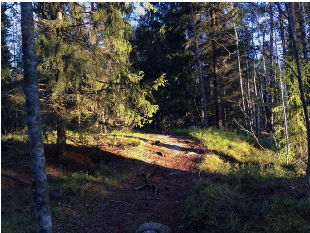
Kuva 4. Olemassa oleva helppokulkuinen polku Jolkbyssä asutuksen välittömässä läheisyydessä. Tätä polkua ei tule hävittää massiivisella rakentamisella ja valaistuksella.