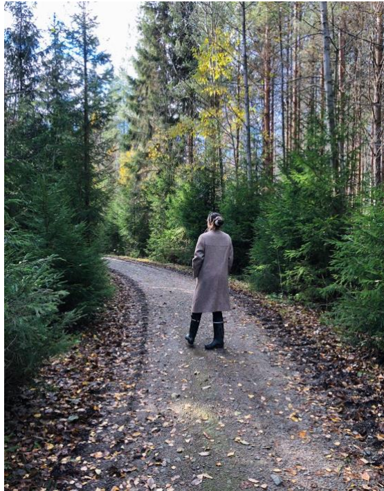
Kuva 3. Olemassa oleva metsätie Keskusmetsän länsipäässä toimisi hyvin pohjana esteettömälle reitille, eikä uutta massiivista tietä tarvitsisi rakentaa asutuksen lähelle.

( https://kirkkonummi.oncloudos.com/kokous/20241919-3-117283.PDF ) ko. keltaisen reitin paikalla olevaa rakentamisesta ei ole päätetty, eikä kaava ole lainvoimainen.