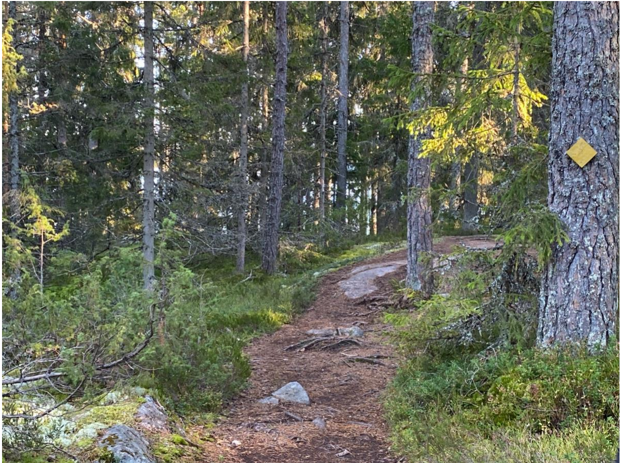
Kuva 1. Meikon ympäri kiertävä polku. Tämän tyylinen reittien rakentaminen sopii myös Keskusmetsään.