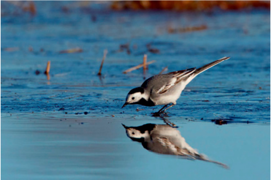
"Aina ystävällinen ja kohtelias västäräkki, kaikkien suosikkilintu"