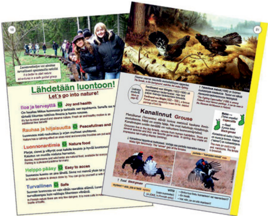
Pari näytesivua kirjasta. Joka vuodelajalle on omat värireunuksella merkityt sivustonsa (tässä esimerkkikuvassa kevään keltainen).