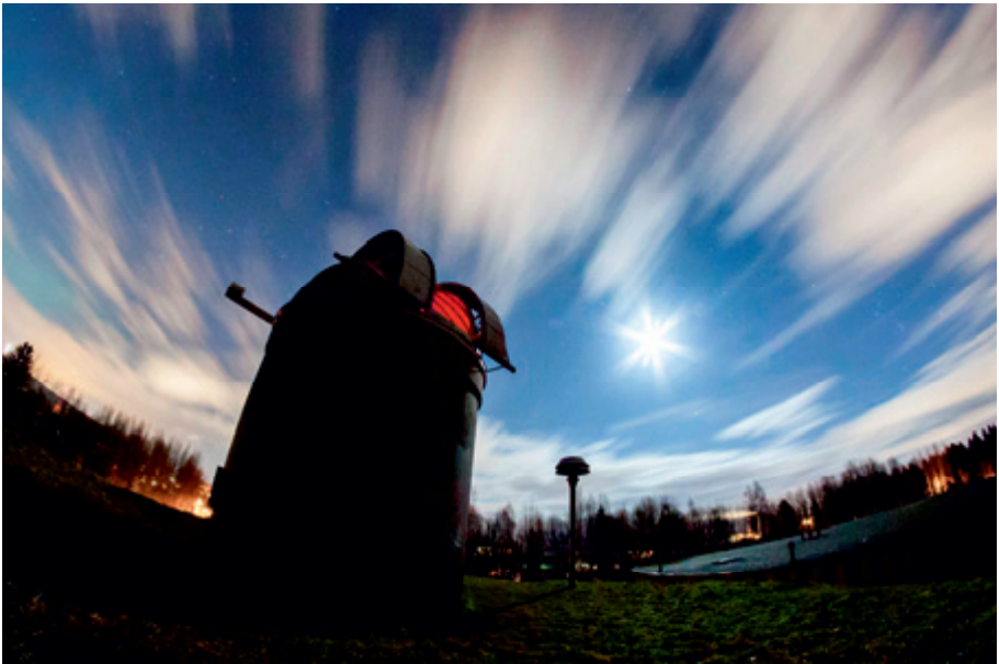
Huuhanmäen tähtitorni.