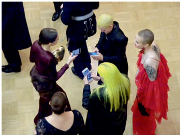
Julkkisten tunnelmat menivät tuoreeltaan someen.