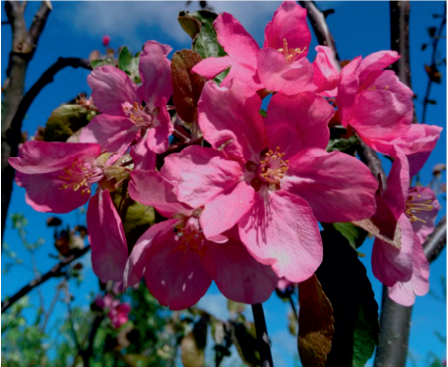
Veiniön- lajikkeen kukkia