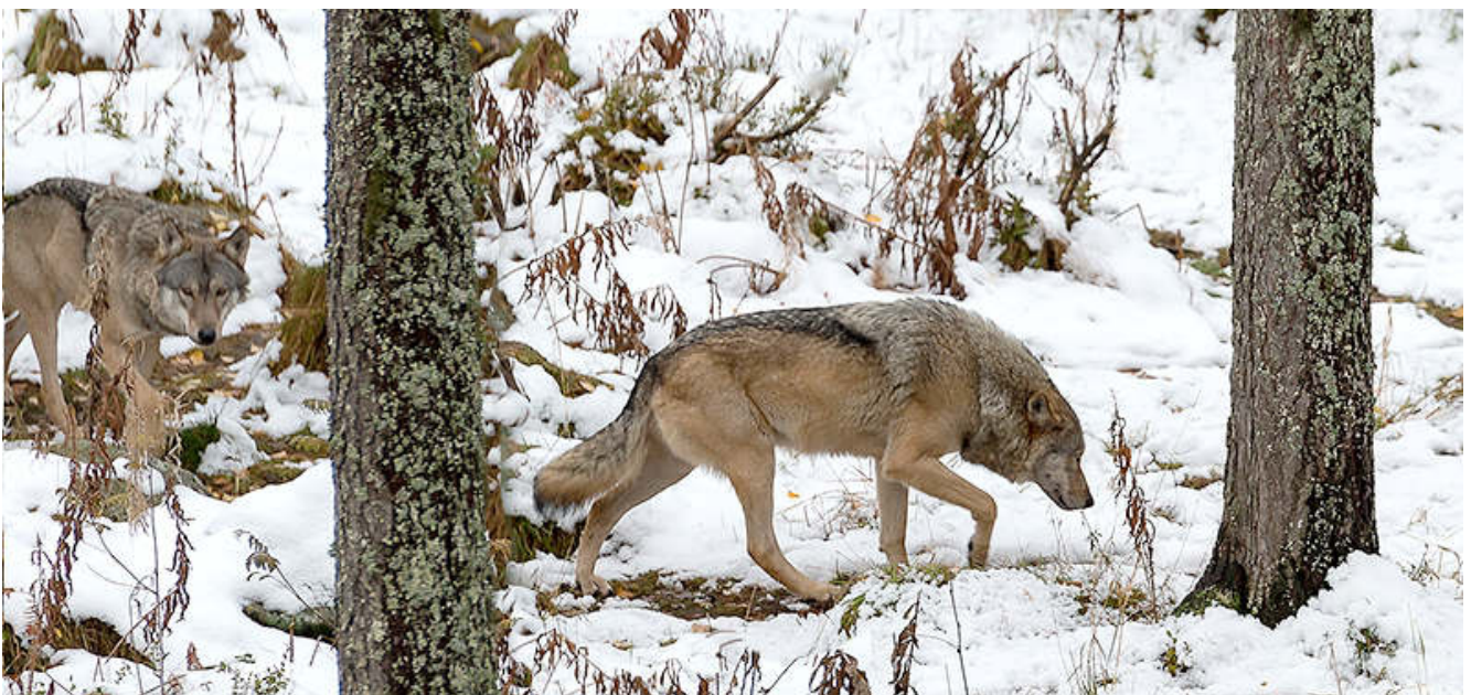
Ranuan eläinpuiston hukkia