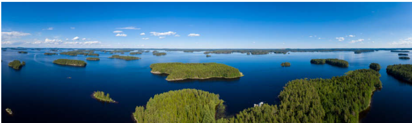
Seppo Ulmanen: Kallavesj´

Järjestetään yhteistyössä Kuopion kaupungin kanssa.