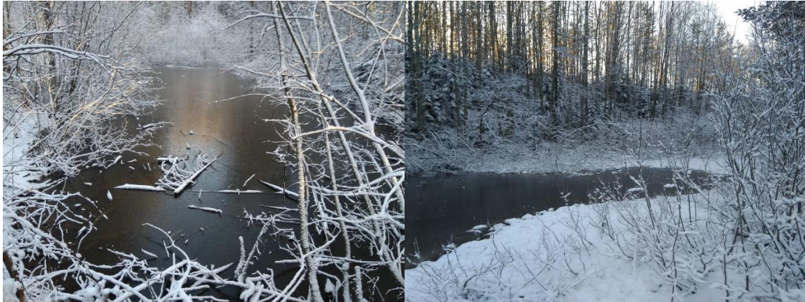
Kuvat (Sara Käkelä): alueen kaksi lampea

Fazerin omistama metsäalue kostuu pääosin monimuotoisesta sekametsästä, jossa on merkittävästi lahoppuuta. Alueella on myös isoja haapoja ja koivuja sekä pihlajaa ja raitaa. Kasvillisuutta on paljon varpu-, pensas- sekä latvakerroksessa. Tulva-alueella sijaitsee iso pajukko, joka on tärkeä vesien imeytymisalue ja pölyttäjien ravinnonlähde kevätaikaan. Alueen kosteus houkuttelee muitakin hyönteisiä ja lisää luonnon monimuotoisuutta.