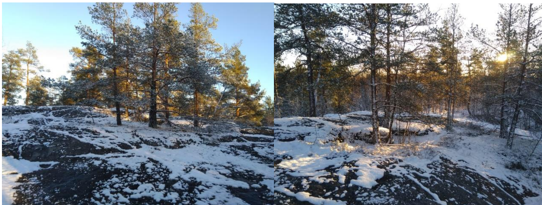
Kuvat (Sara Käkelä): kalliialuetta kaupungin omistamalla alueella

Vantaan kaupungin omistamalla alueella kasvaa pääosin mäntyvaltaista sekametsää, jossa on vanhoja kilpikaarnaisia mäntyjä. Luontotyyppinä on tuore kangas ja mustikkaturvekangas. Metsää on hoidettu ulkoilu- ja virkistysmetsänä ja metsäsuunnitelmassa alueelle on merkitty arvometsää. Metsän tulisi säilyä virkistysmetsänä jatkossakin. Alueella on myös mäntyjä ja katajia kasvava kalliokuvio, joka jatkuu Fazerin maanomistuksen puolelle.