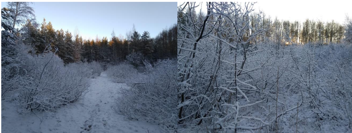
Kuvat (Sara Käkelä): tulva-alueen pajukkoa

Alueen kaakkoisreunalla on istutusmännikkö, jonka männyt vaikuttavat olevan ulkomaalaista lajiketta. Istutusmännikkö on tiheää ja kasvustoltaan yksipuolista eivätkä sen luontoarvot ole kovin suuret. Männikön läpi kulkee kuitenkin ekologinen yhteys etelään Långmossenille päin. Näin ollen yhdistyksemme vastustaa tällekin alueelle rakentamista ja näkee että, alueella pitäisi tehdä ennallistamis- ja monimuotoisuustoimia ja lisätä lahoppuun määrää kaatamalla yksittäisiä puita.