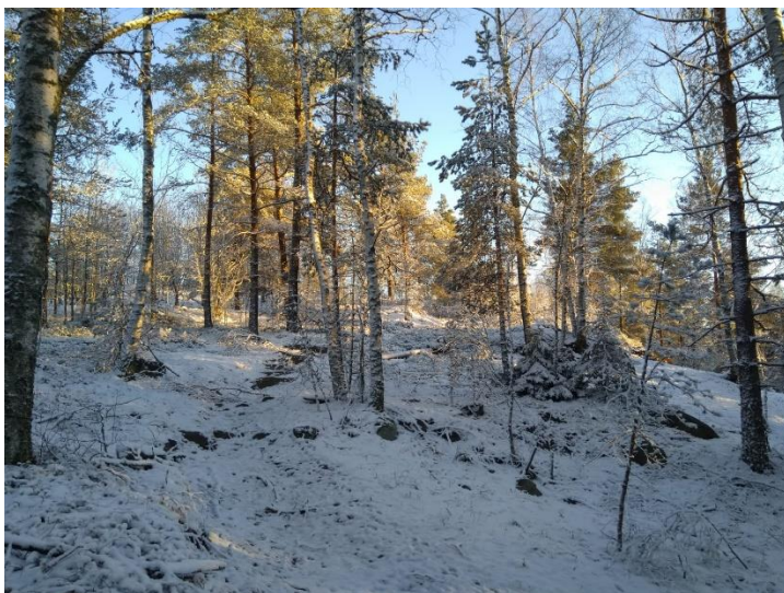
Kuva (Sara Käkelä): metsää suunnittelualueelta

Vesa Järvinen SLL Vantaa, varapuheenjohtaja