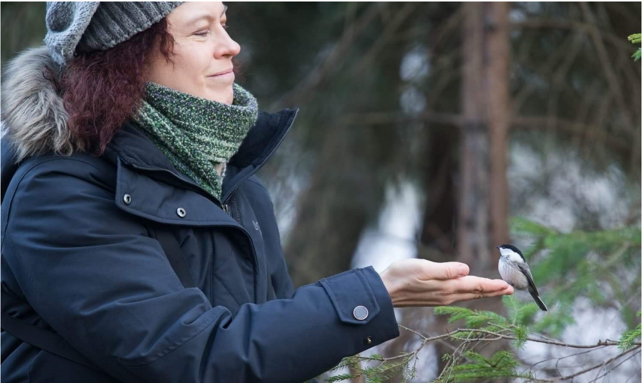
Hömötiainen tekee tuttavuutta.

Lintujen talviruokintaa Pappilanpuistossa on hoidettu myös vuonna 2024. Vanha ruokinta-automaatti olisi jo syytä korvata uudella, mutta muutosta ei ehditty syksyllä tehdä ennen maan jäätymistä, joten vaihto tehdään vasta keväällä 2025.