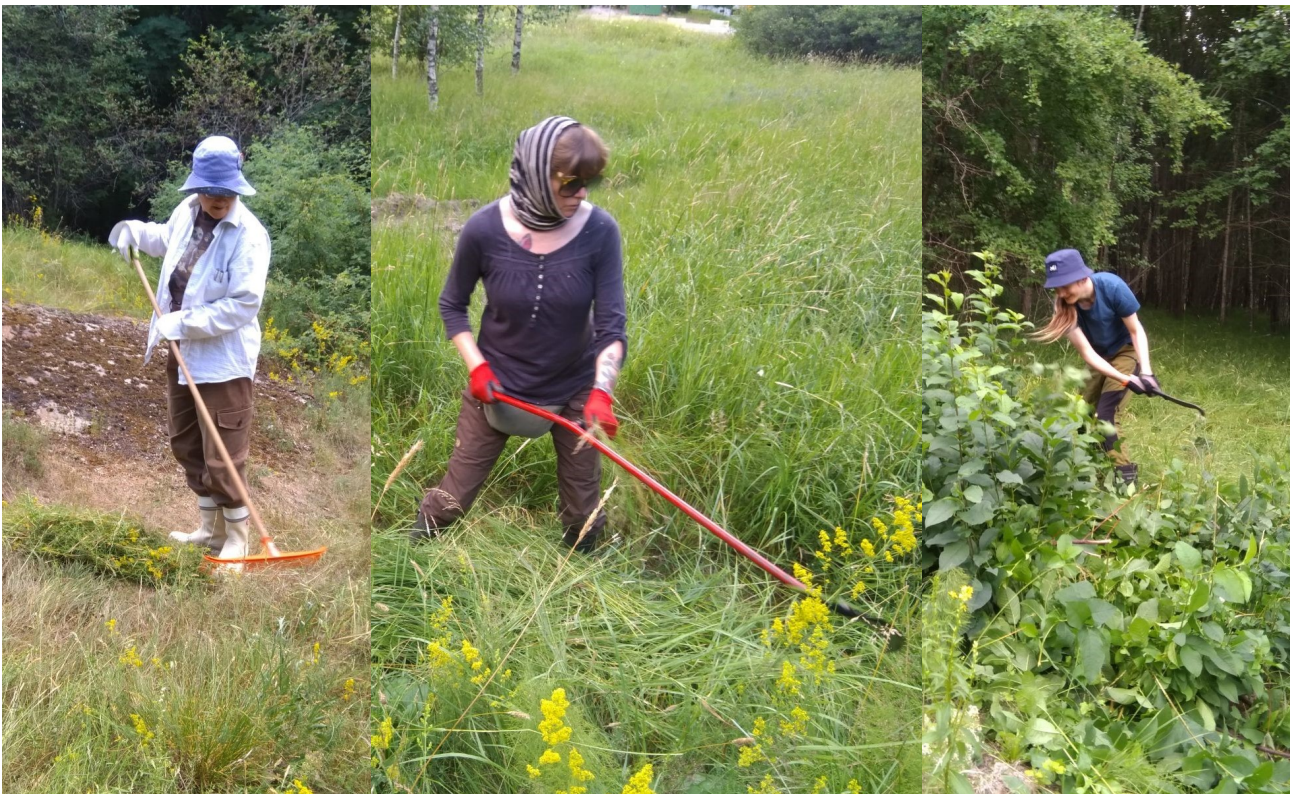
Erilaisia ketotalkootyylejä: hallitusti haravalla, viehkeästi viikatteella ja villisti vesurin kanssa.

Kedon hyönteiskartoituksesta puhuimme kyllä tänäkin vuonna, mutta projekti ei ole vielä edennyt puheita pidemmälle, koska emme ole tavoittaneet yhtäkään halukasta hyönteistuntijaa/harrastajaa.