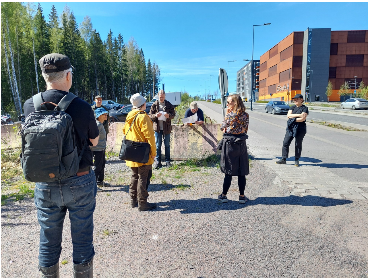
Maastokatselmus Kivistössä yhdessä Vantaan kaupungin ja Suomen luonnonsuojeluliiton Uudenmaan piirin edustajien kanssa.

Kauden 2024 aikana luonnonsuojeluryhmä on pitänyt kolme kokousta , jotka ovat olleet etäkokouksia. Työryhmä osallistui myös 2.6. Lisää ääntä -ilmastomarssiin ja metsämarssiin 17.8.