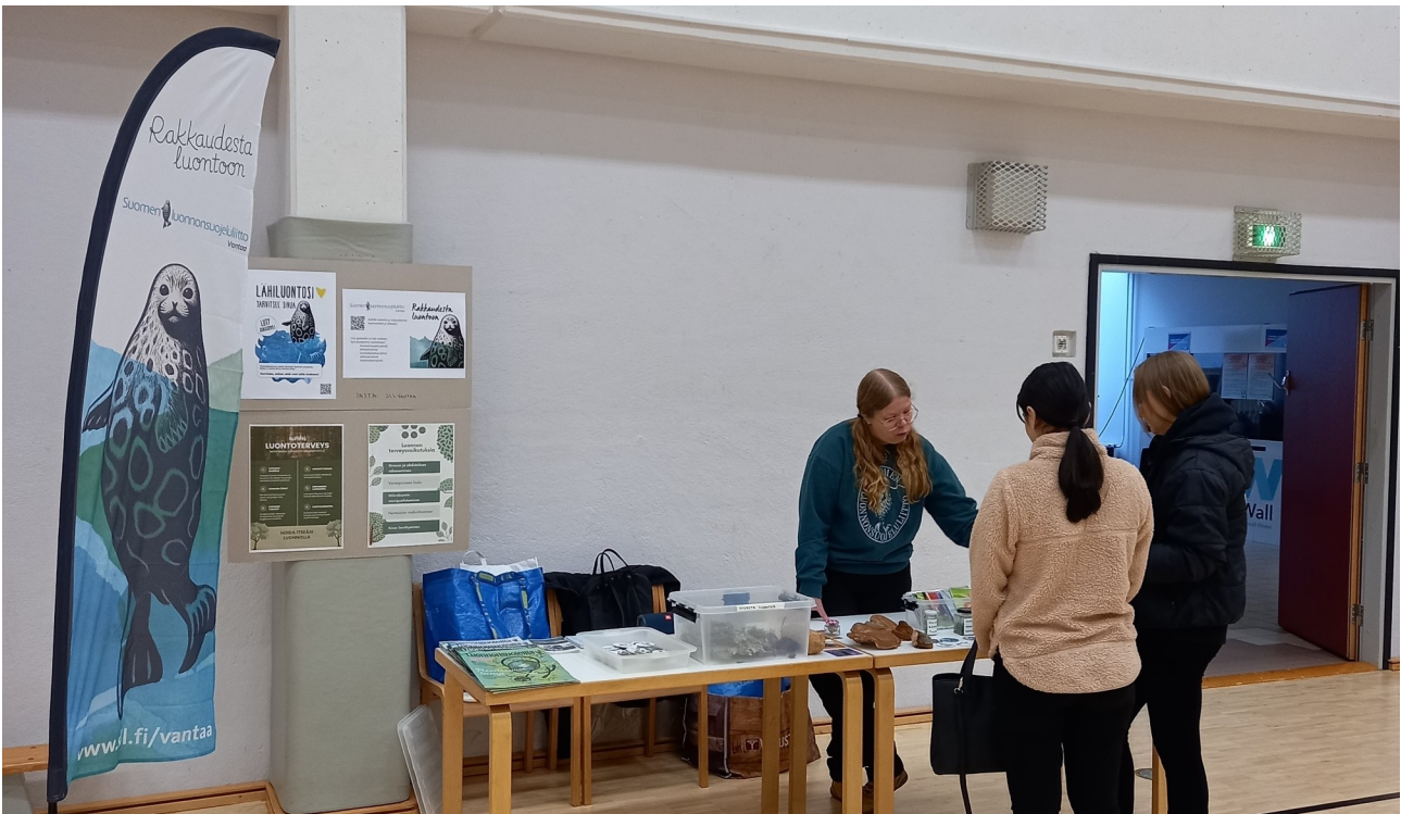
Yhdistyksen pöytä Varian hyvinvointimessuilla.

Yhdistyksen käytössä on nyt kaksi pisaralippua lisäämään näkyvyyttä tapahtumissa. Toinen pisaralippu oli ensikäytössä Varian hyvinvointimessuilla yhdistyksen pöydän äärellä kiinnittämässä opiskelijoiden huomiota.