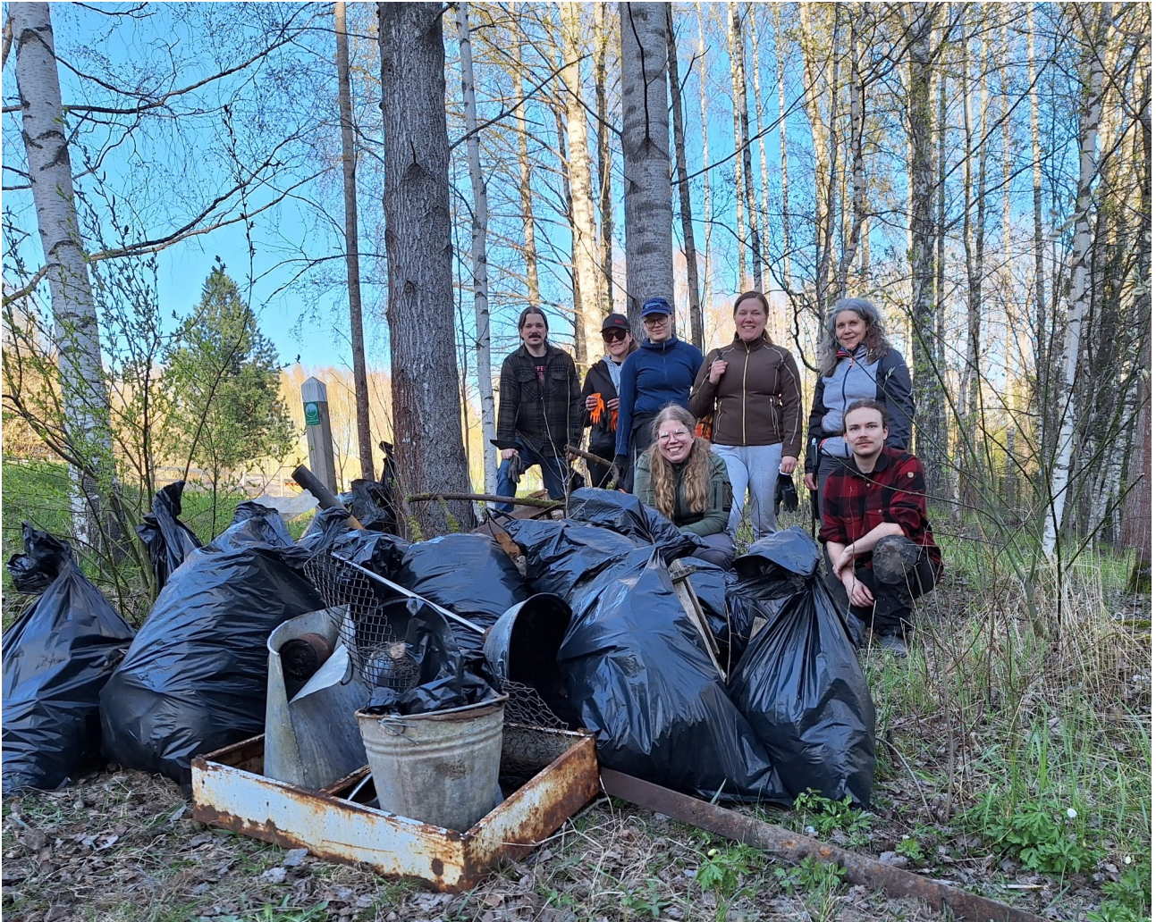
Roskatalkoiden saalista.

Roskatalkoita pidettiin keväällä heti lumien lähdettyä sekä Nissaksessa että Mätäojalla. Roskia saatiin yhteensä kerättyä useampi pakettiautollinen. Pienroskan lisäksi luonnosta kannettiin pois esimerkiksi autonrenkaita, grillejä ja iso läjä alumiiniputkia.