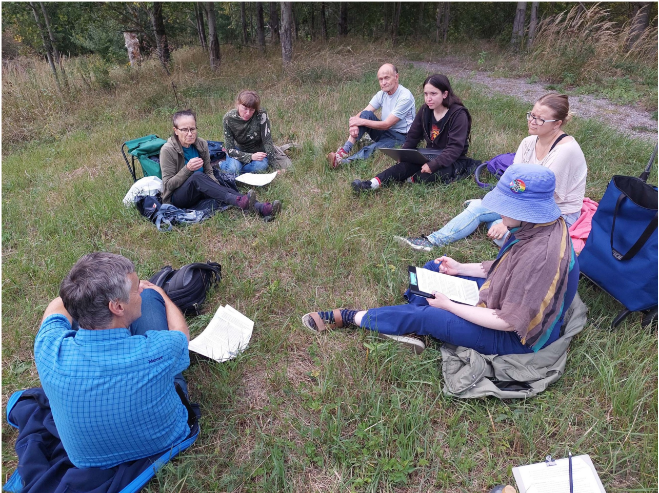
Hallituksen kokous Kolmen koivun luotopolun varrella.

Yhdistyksemme toimintaa ohjaava hallitus kokoontui vuonna 2024 kaikkiaan 14 kertaa, joista neljä järjestettiin ulkona. Hallitus kokoontui joka kuukausi. Helmikuussa kokouksia oli useampi johtuen vuosikokouksesta. Koska kestitysvastaavaa ei vuodelle 2024 valittu, kokouksien tarjoilusta vastasi useampi henkilö erikseen sovitusti. Ulkokokouksissa ei oletusarvoisesti ollut tarjoilua lukuun ottamatta Tuupakan kedolla ollutta kokousta, jossa tarjolla oli talkoolaisilta jääneitä leipiä.