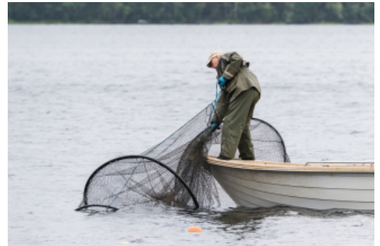
Norppaturvallista kalastusta edistetään katiskatalkoissa ja -tapahtumissa. Joissain tapahtumissa esitellään myös norppaturvallista rysää.