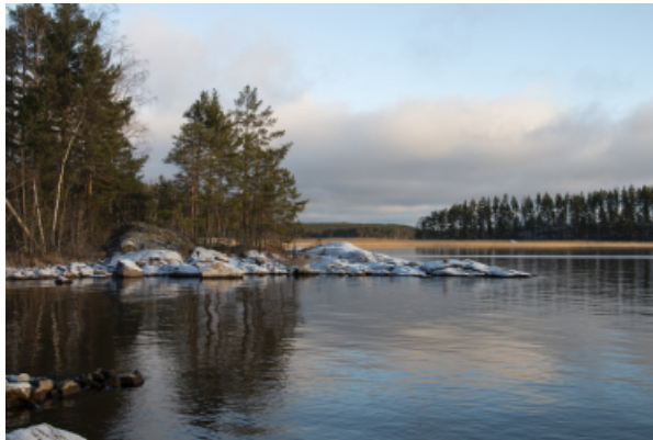
Marraskuun valo Saimaalla pari vuotta sitten.

Tapaus kuitenkin osoittaa, että saimaannorpat uivat pitkiäkin matkoja hyvin kapeista ja matalista salmista paikkoihin, joissa niitä ei ole totuttu näkemään. Onkin sanottu, että saimaannorpan voi avovesiaikaan nähdä lähes joka Saimaan kolkassa, nyt myös Pien-Saimaalla. Pesimisalueet ovat huomattavasti suppeampia, ja levittäytyminen pesiväksi kannaksi jo kertaalleen autioituneelle alueelle voi viedä vuosikymmeniä, jos ylipäättään olosuhteet ovat sille suotuisat. Mutta kannan levittäytyminen alkaa näistä rohkeista yksinäisistä seikkailijoista!