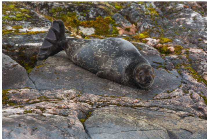
Saimaannorppakanta on vankempi kuin muutama vuosikymmen sitten, mutta suojelutyötä tarvitaan edelleen. Norppa on edelleen erittäin uhanalainen. Suotuisan suojelun tasosta ollaan kaukana.

Työryhmät jatkavat työskentelyä. Seuraavan kerran seurantaryhmä kokoontuu keskustelemaan asiasta helmikuussa 2022.