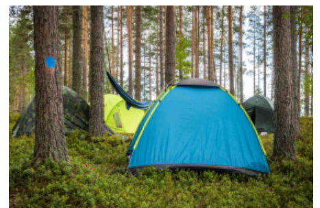
Norppa-asiaa ja leirielämää Turponsaarella.