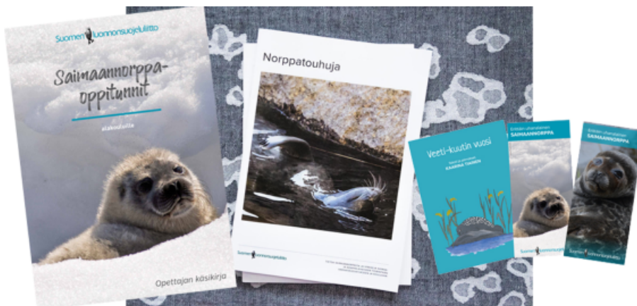
Esimerkkejä tuotetusta materiaalista.

Ensimmäinen tilaisuus pidetään Lappeenrannan kirjaston Tarinasalissa 9.12. klo 17-18.30. Lisä- ja ilmoittautumistietoja tulee lähiaikoina.