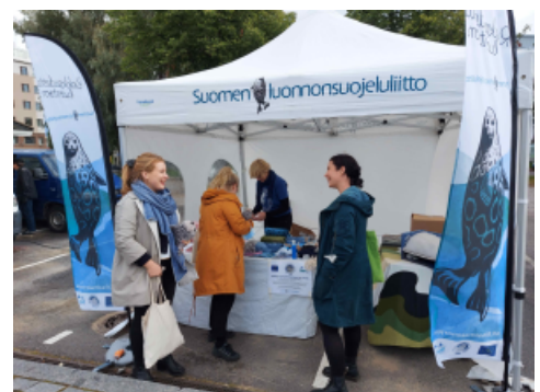
Eri-ikäiset tapahtumavieraat saivat kesätapahtumissa tietoa ja elämyksiä norpasta. Riihisaarissa jaettiin myös norppaturvallisista Saimaa-katiskoja.