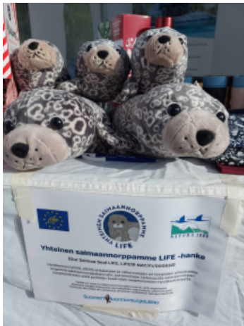
Yhteinen saimaannorppamme LIFE -hanketta on nyt tehty lähes vuosi. Hanke jatkuu vuoden 2025 loppuun.

Jatkossa perehdymme myös tarkemmin keinopesien kehittelyyn. Tarvittaessa olemme niiden lupaprosesseissa, testaamisessa ja sijoittelussa mukana yhteistyössä Itä-Suomen yliopiston ja mahdollisten muiden toimijoiden kanssa. Tämä jos mikä on yhteistyötä monien tahojen kanssa.