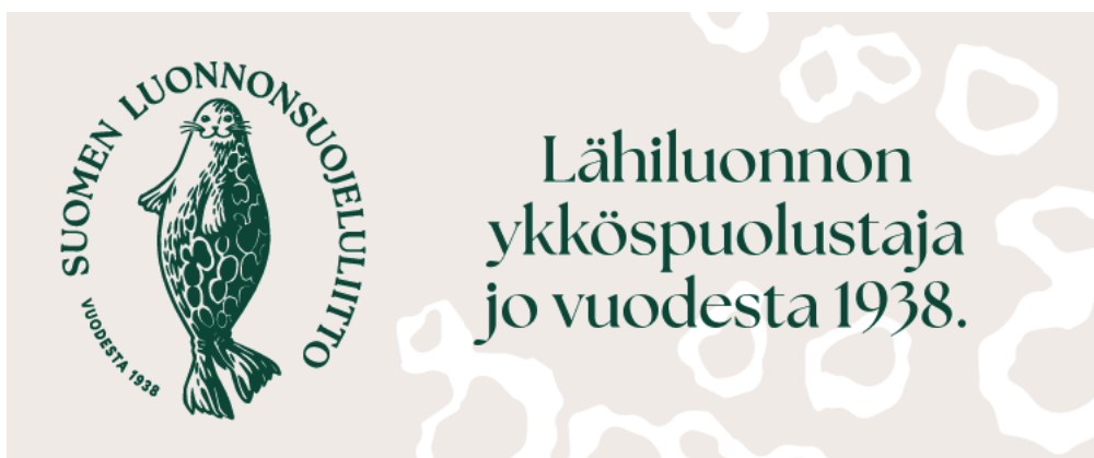
Kuva Eveliina T.