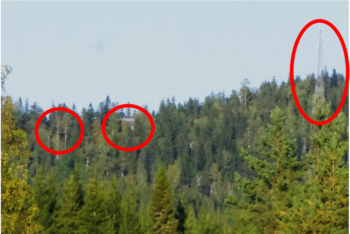
Kuva 3. Suora näköyhteys: kiskohissi, luontokeskus ja telemasto näkyvät ottopaikalle