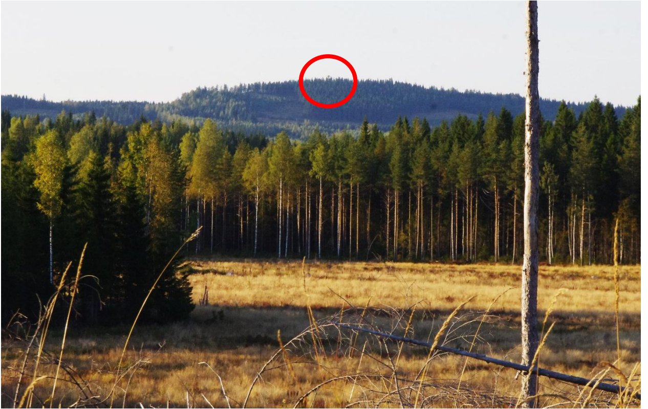
Kuva 5. Räsävaaran näkötorni ottopaikalta kuvattuna