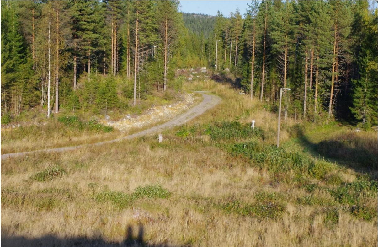
Kuva 1. Näkymä suunnitellulta ottopaikalta Akka-Kolin huipulle (kuvaajan varjo etualalla). Hiihtoladun valopylväs etuoikealla