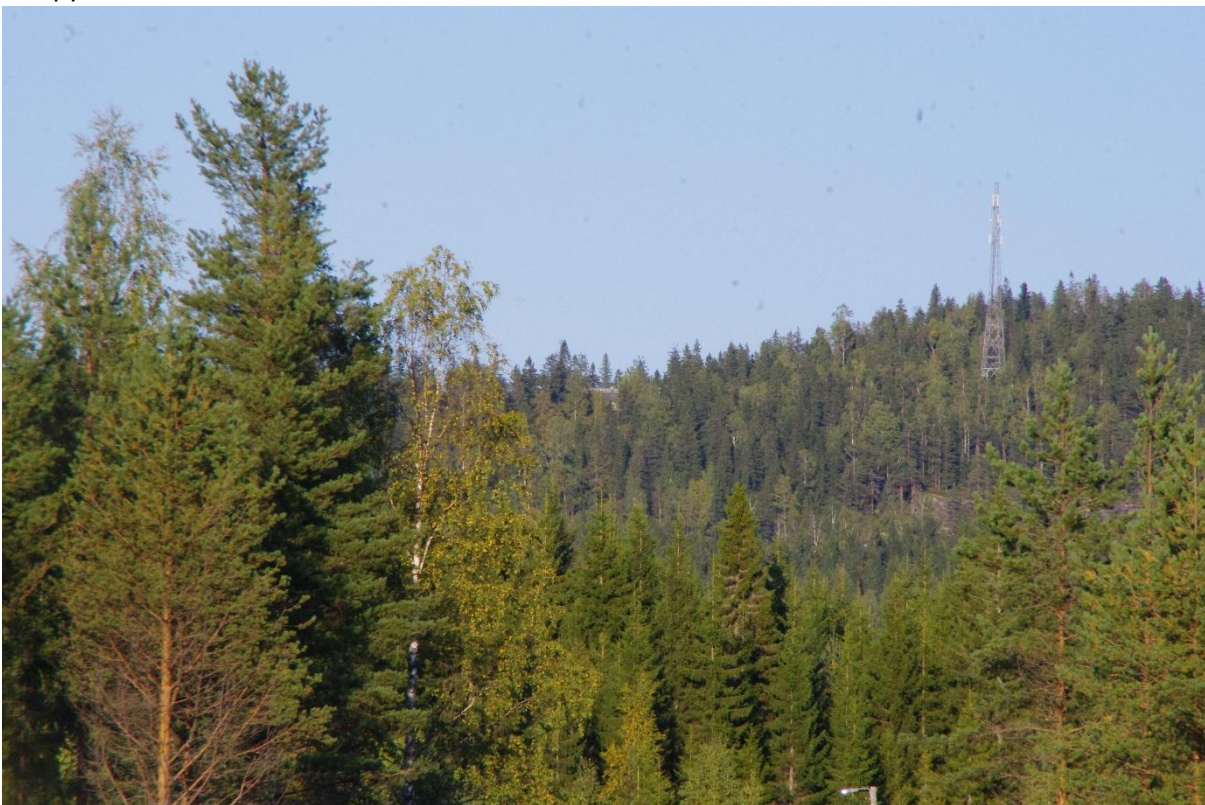
Kuva 2. Kolin luontokeskus ja telemasto kuvattuna suunnitellulta ottopaikalta