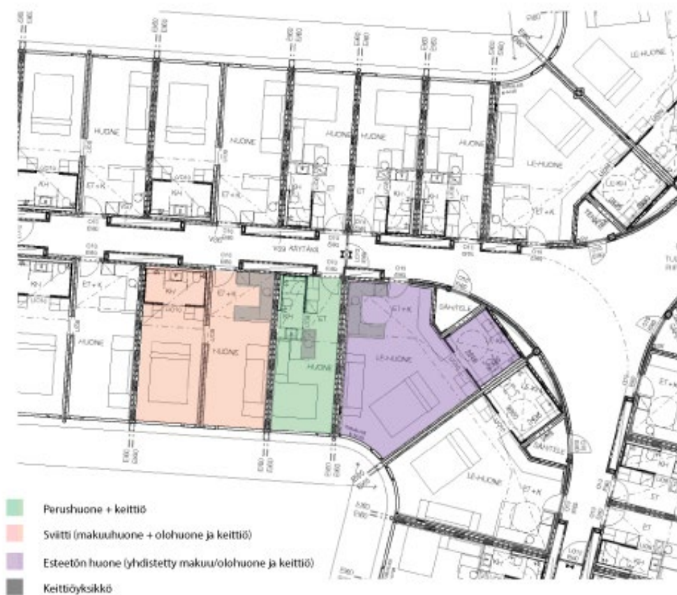
Soulmade Taivalsaari huoneistotyypit + keittiöyksiköt

Kylpylärakennustyyppi puolestaan palvelee enemmän lyhytaikaista ”staycation” viikonlopun mittaista majoitustarvetta, jolloin huoneissa ei keittiöille tai pyykinpesutiloille ole tarvetta. Ks. myös liite 13:Huoneistotyypit.