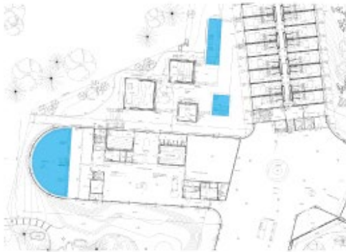
Soulmade Taivalsaari I-kerros