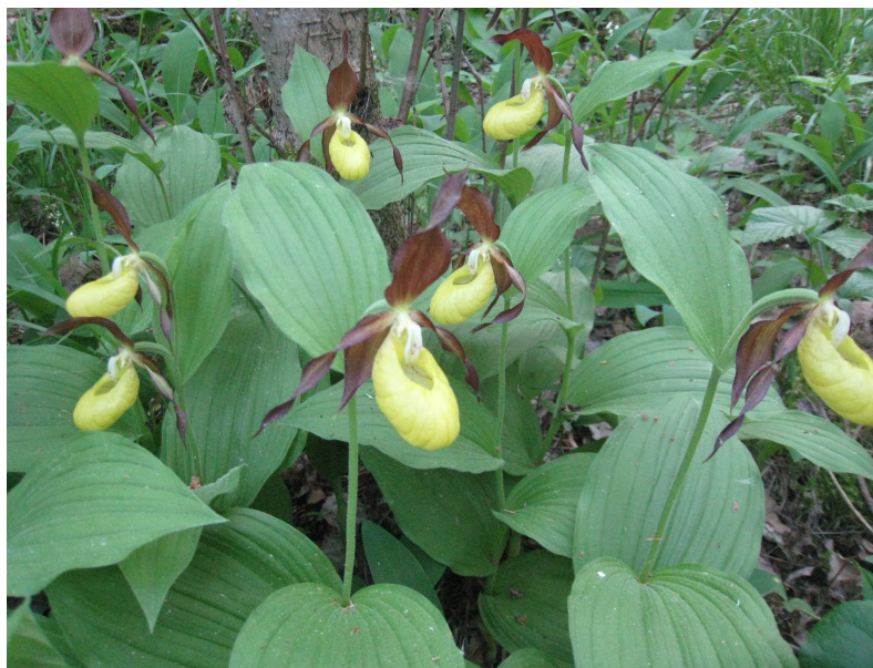
Huosiaisniemen tikankontteja kesäkuussa 2011