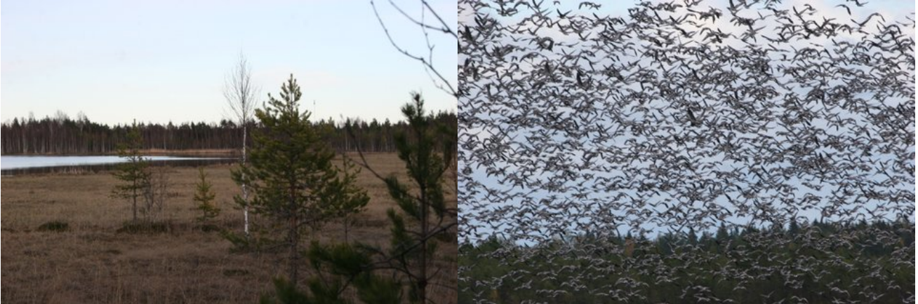
Näkymä Höytiönsuolta ja Höytiönlammen hanhimassaa syyskuussa 2012.

Suojelualue koostuu kolmesta erillisestä suoalueesta, joita ovat Höytiönsuo/Höytiönlampi alueen itäosassa vankilan peltojen takana, Mantereensaarensuo Kivisaarentien eteläpuolella ja Hyvätilänsuo Kivisaarentien pohjoispuolella. Myöhemmin suojelualueeseen liitetään myös turvetuotannosta vapautuva noin 180 ha alue, joka rajautuu Hyvätilänsuohon. Tälle alueelle on tarkoitus perustaa lintukosteikko. Lintukosteikon perustaminen on lintujen pesinnän ja muuttoaikaisen lepäilyn kannalta tärkeää, koska Konnunsuolla linnustollista potentiaalia riittää. Kosteikon perustaminen alkaa noin viiden vuoden kuluttua kosteikkoalueen vapauduttua lopullisesti turpeenkaivuusta.