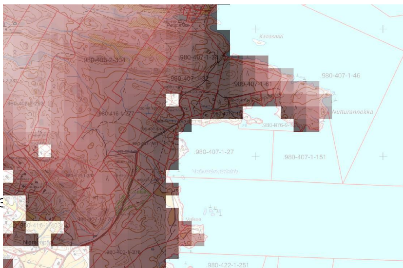
Kuva 2. Liito-oravan elinympäristön ennustekartta -tarkastelussa Nutturan niemen alue on liito-oravalle potentiaalista elinympäristöä. Mitä tummempi alue kartalla on, sen potentiaalisempaa elinympäristöä alueella on arvioitu metsävaratietojen

Nutturan tila on luonnoltaan ja maisema-arvoiltaan erityisen arvokas kokonaisuus. Nutturan tilan ranta-asemakaavaluonnoksen rantametsät ovat Tampereen kaupungin vanhojen metsien suojeluselvytyksessä (2006) suurelta osalta määritelty arvokkaaksi vanhojen metsien alueeksi (kts. liite 1), joka tulisi näin ollen ehdottomasti säilyttää mahdollisimman luonnontilaisena. Myös saaren ja mantereen välinen yhteiseen vesialueeseen kuuluva kosteikko tulisi säilyttää luonnontilaisena. Alueella on valitettavasti tehty jo ennakkoon viime talvena toteuttamistoimenpiteitä: hakkuita, kallionlouhintaa ja vesialueen täyttöö.