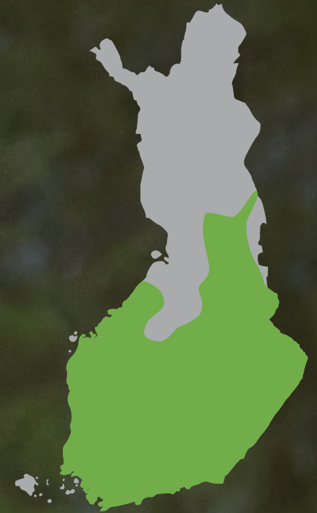
Liito-oravan levinneisyys Suomessa

Liito-oravan suojelu on samalla metsäluonnon monimuotoisuuden ja ihmisille sopivien virkistymetsien suojelua.