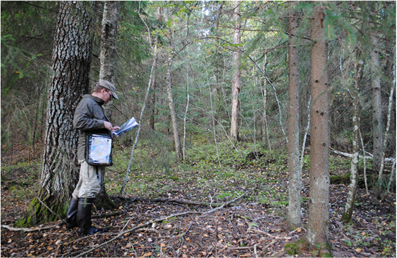
Liito-oravaselvitystä optimibiotoopissa. Tällainen metsä on asutun liito-oravareviirin ydinaluetta.