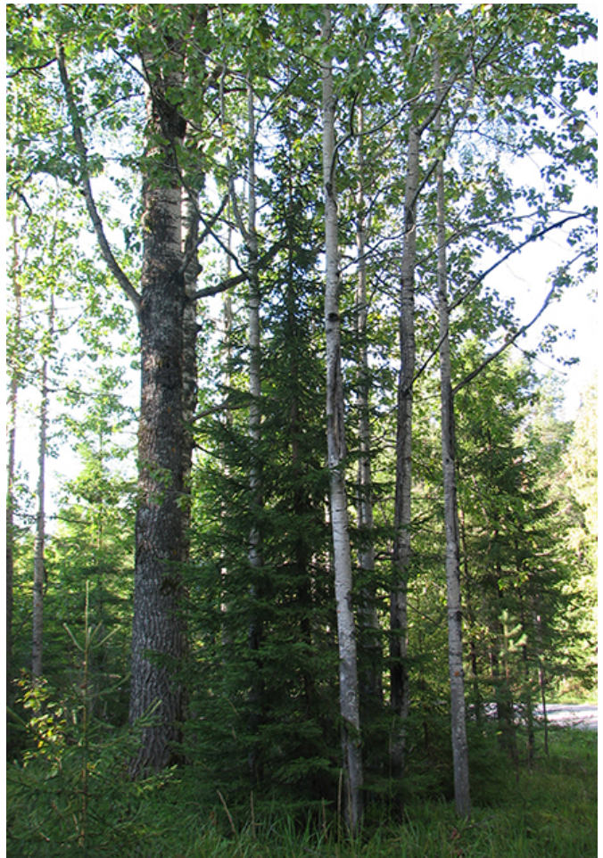
Liito-oravan liikkumisreittejä tukee lehtipuu- ja kuusitiheiköt, jotka tarjoavat suojaa.