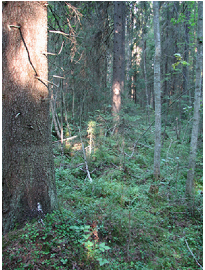
Eri-ikäisrakenteiseksi kasvatettu metsä lisää puuntuotantoa ja samalla mahdollistaa metsän toipumisen häiriöiltä.