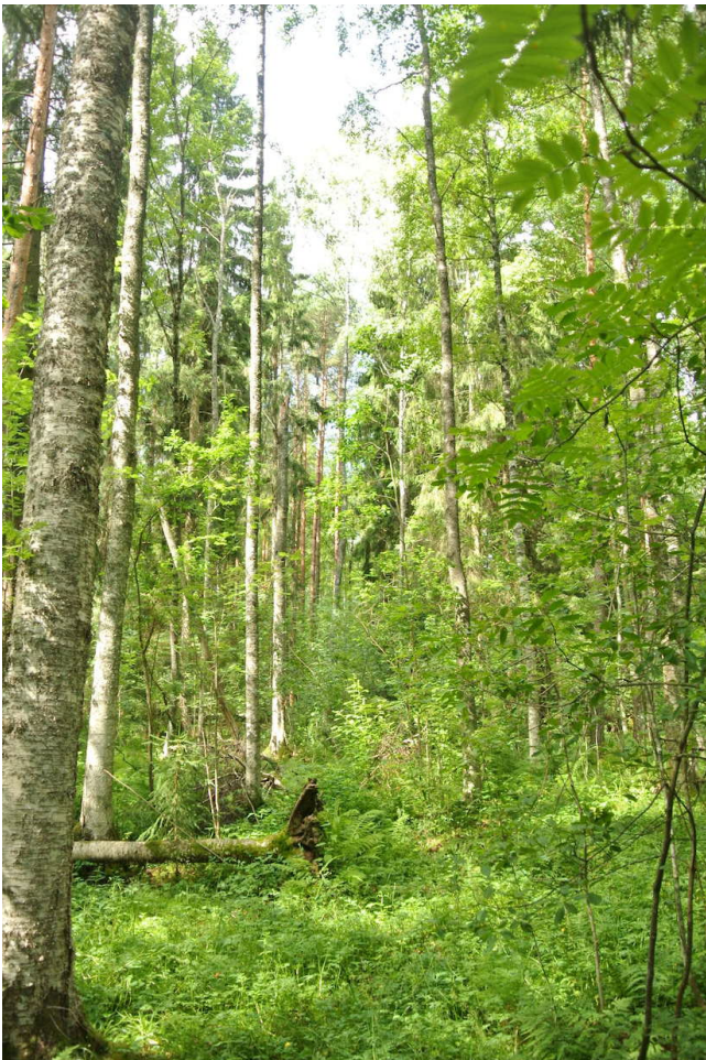
Lehtolaikut ja muut ympäristöään rehevämmät kohteet tulee huomioida metsäsuunnittelussa.

Tunnettujen liito-oravan havaintopaikkojen ympäristössä tarkistetaan hakkuusuunnitelmien yhteydessä tammi-kesäkuussa (kevällä lumien sulaessa tai sen jälkeen) mahdolliset liito-oravan asuttamat kohteet katsomalla, onko erityisesti metsikön suurimpien kuusten ja/tai haapojen tyvillä liito-oravan papanoita. Papanalöydöspaikat ovat liito-oravan reviiriä ja niillä toimitaan kuten aiemmin tiedossa olevilla liito-oravareviireilläkin.