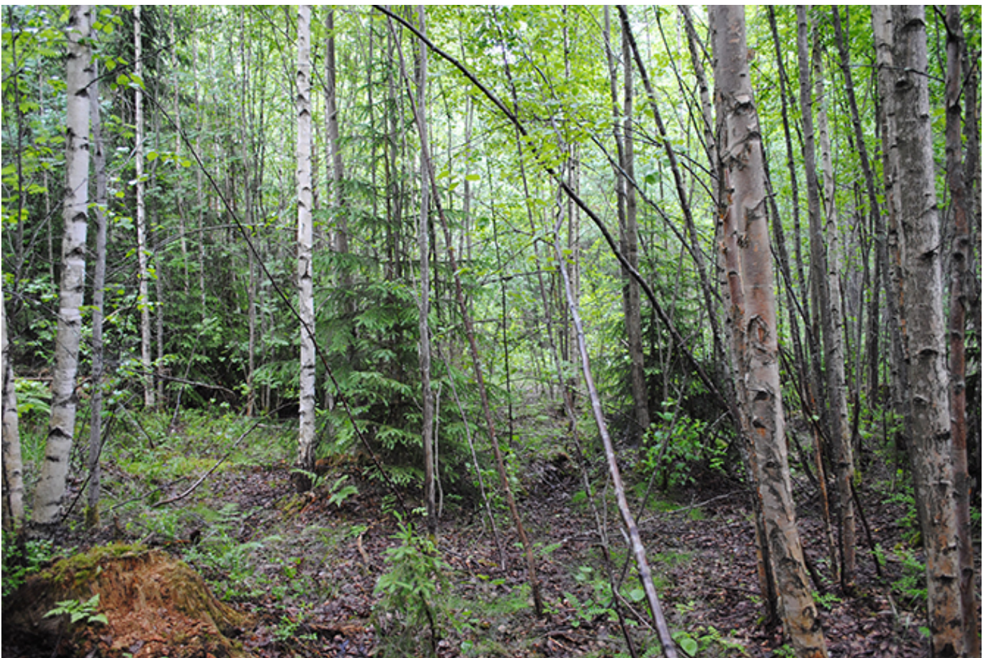
Nuoresta monipuolisesta sekametsästä kehittyy ajan saatossa hyvä liito-oravametsä, ellei sitä pilata kaavamaisella metsänkäsittelyllä.