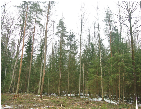
Liito-oravametsässä ei pidä tehdä avohakkuuta. Kuvasa avohakkuuta tehtynä liian lähellä metsänrajassa sijaitsevia pesimäpuita. Hakkuut ovat vähintäänkin heikentäneet lisääntymispaikkaa ja pienentäneet liito-oravalle käyttökelpoisen metsän osuutta reviirillä.