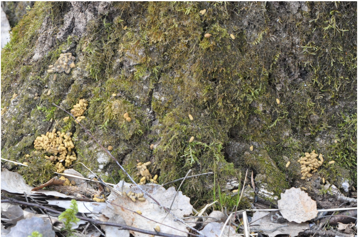
KUVA 2. Liito-oravan papanoita pesäpuun juurella.

Liito-oravan merkkejä ei ole tarpeen etsiä taimikoista, keskipituudeltaan alle 10 metriä olevista metsi- köistä, pelloilta ja muilta avoimilta alueilta eikä yhden puulajin männiköistä.