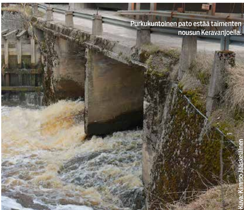
Purkukuntoinen pato estää taimenten nousun Keravanjoella.