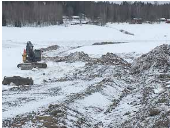
Keväällä Johannesbergille rakennetun ”mökin remonttien” pohja johtaa jo mökin ohi.

Sain syksyisenä päivänä puhelun, jonka sisältö oli yhtä aikaa hämmentävä ja arvattava. Evitskogiin oltiin aloittamassa yli 30 hehtaarin pellonparannukseksi naamioitua maankäyttöpaikkaa. 800 000 kuutiota ylijäämämaita läjitettäisiin kosteikolle, joka on muuttolinnoille tärkeä levähdyspaikka ja keskeinen tukialue ympäristön FINIBA-alueisiin (Suomen tärkeät lintualueet) kuuluville pesimäjärville. Lakisääteisen lupaprosessin sijaan täyttö oli alkamassa pelkällä ympäristöpäällikön lausunnolla.