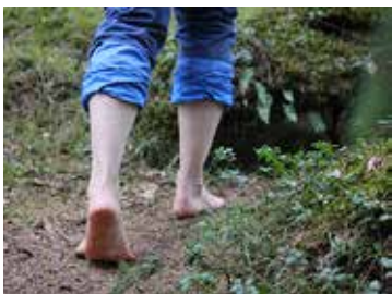
Kuva: Leila Häkkinen

• Seuraa retkitarinoita netissä: sll.fi/uusimaa/luontoretkeilykohteet .