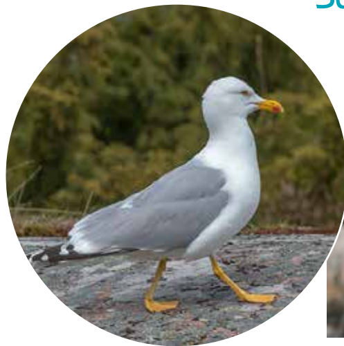
Harmaalokin katse on terävä. Kalalokilla ei ole punaista täplää nokassaan.