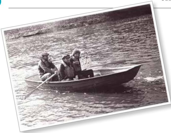
Kyltti kehottaa uimaan Vantaanjoessa. Helsingin perustamisen aikoihin Vantaanjoki kärsi aiempien vuosikymmenien rankasta jätevesikuormituksesta, joten kyse lienee ollut kannanotosta jokiveden laatuun.

Idea Vapaudenkadusta nousi 1900-luvulla esiin lukuisia kertoja ja se oli esillä myös Helsingin ensimmäisinä vuosikymmeninä. Kuva on otettu 1980-luvun alussa.