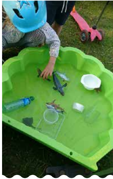
Lapset auttoivat merieläimiä selviämään roskaisessa meressä kesällä 2019 pidetyssä rantojen siivoustopahtumassa.

”Toivomme mukaan kaiken ikäisiä, jotka ovat kiinnostuneita Itämerestä. Haluamme jatkaa ruohonjuuritason