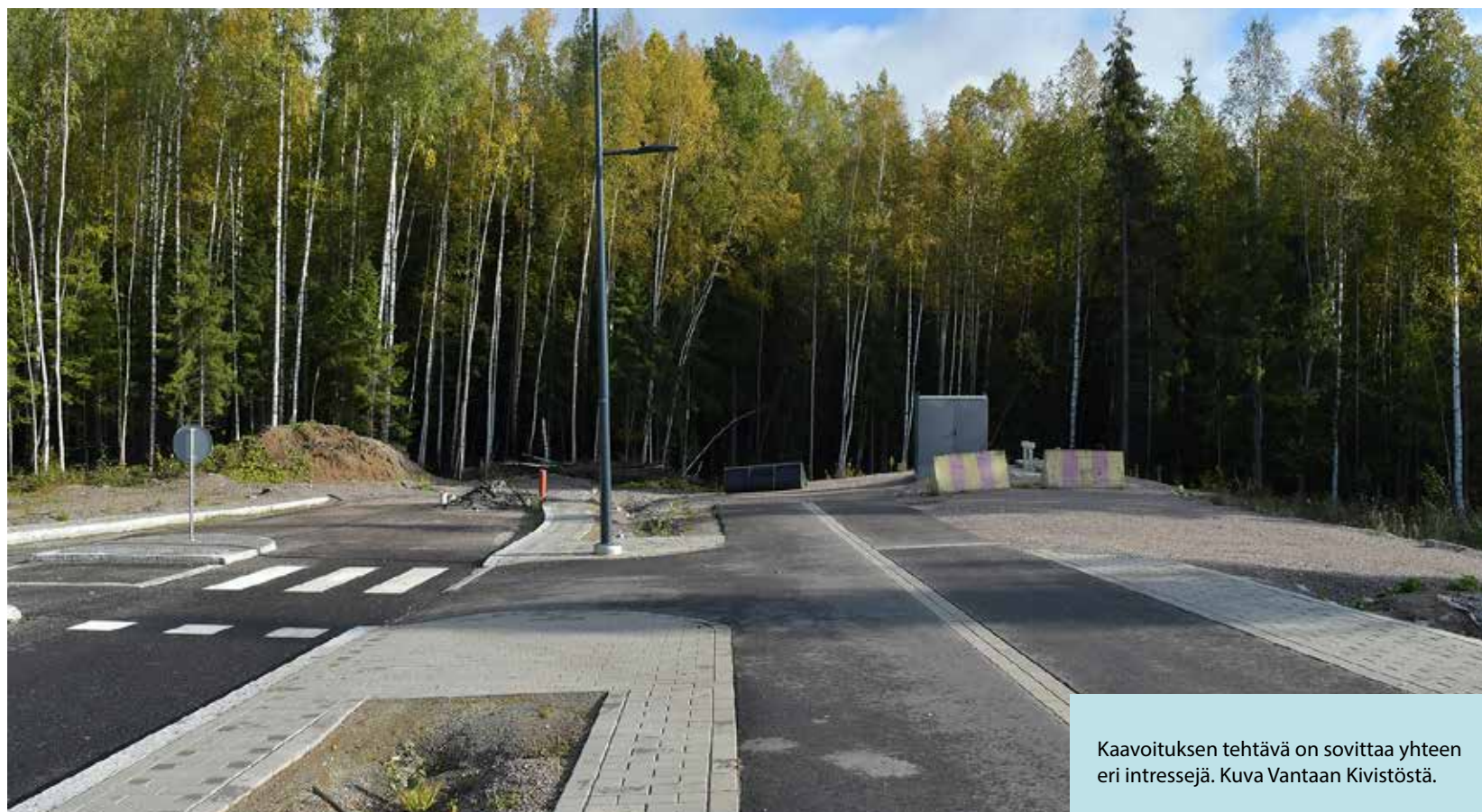
Kaavoituksen tehtävä on sovittaa yhteen eri intressejä. Kuva Vantaan Kivistöstä.

Näin suuren näkemyseron selvittäminen vaatii lukujen perkaamista.