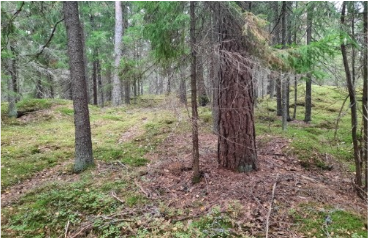
Näkymä äskettäin avohakatun boreaalisen luonnonmetsän alueelta vielä jäljellä olevaan boreaaliseen luonnonmetsään.