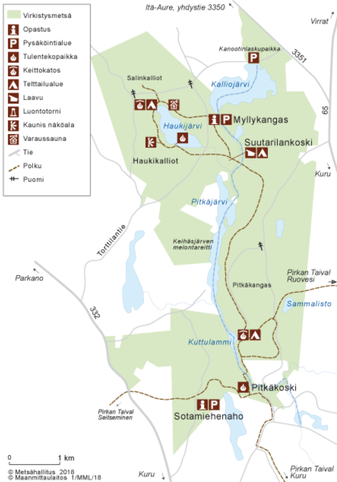
Kuva: Riuttaskorven virkistymetsä, Reittikartta, luontoon.fi.