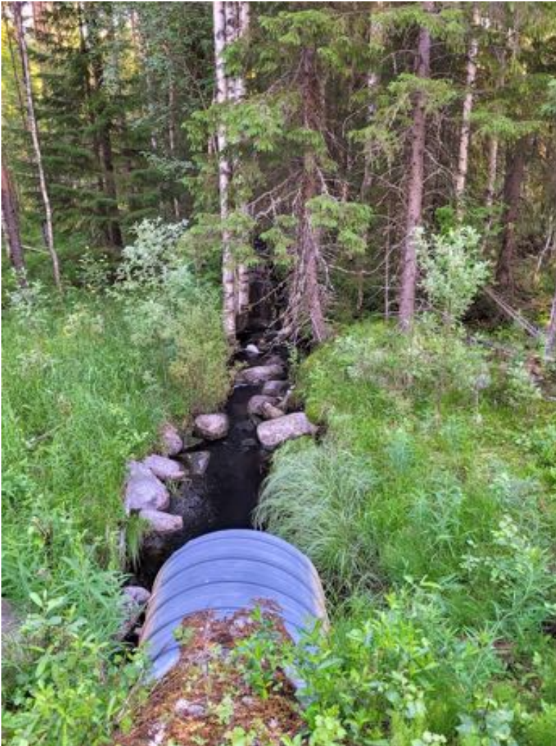
Mäenaluspuro tien kohdalla

Kylmäpurolle menimme lähelle sen luhta-aluetta laskeutuen käännöspaikalta. Hätkähdyttävän kaunis puro virtasi metsän sisällä, pieni (koski)muodostumakin. Kasvillisuudesta mm. hentosara, harajuuri, raate, tupasvilla, metsäkorte, pohjanpaju, rahkasammalista hete- ja sararahkasammal, suomuurainta runsaasti korpimaisella alueella. Majava oli katkaissut ohuen puun ja tehnyt lastuja. Linnuista vain peippo, tiltalti ja käki äänessä.