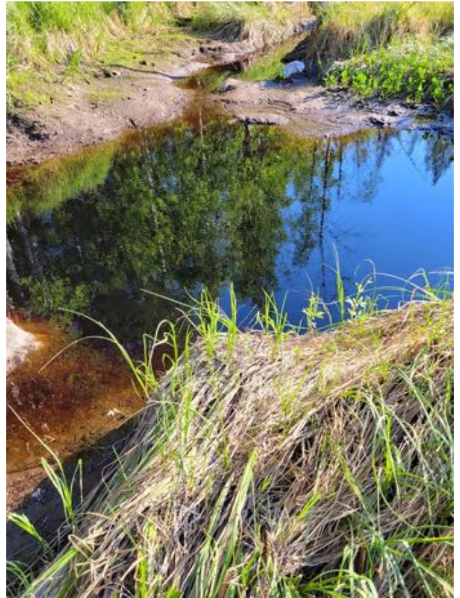
Puron varren metsää