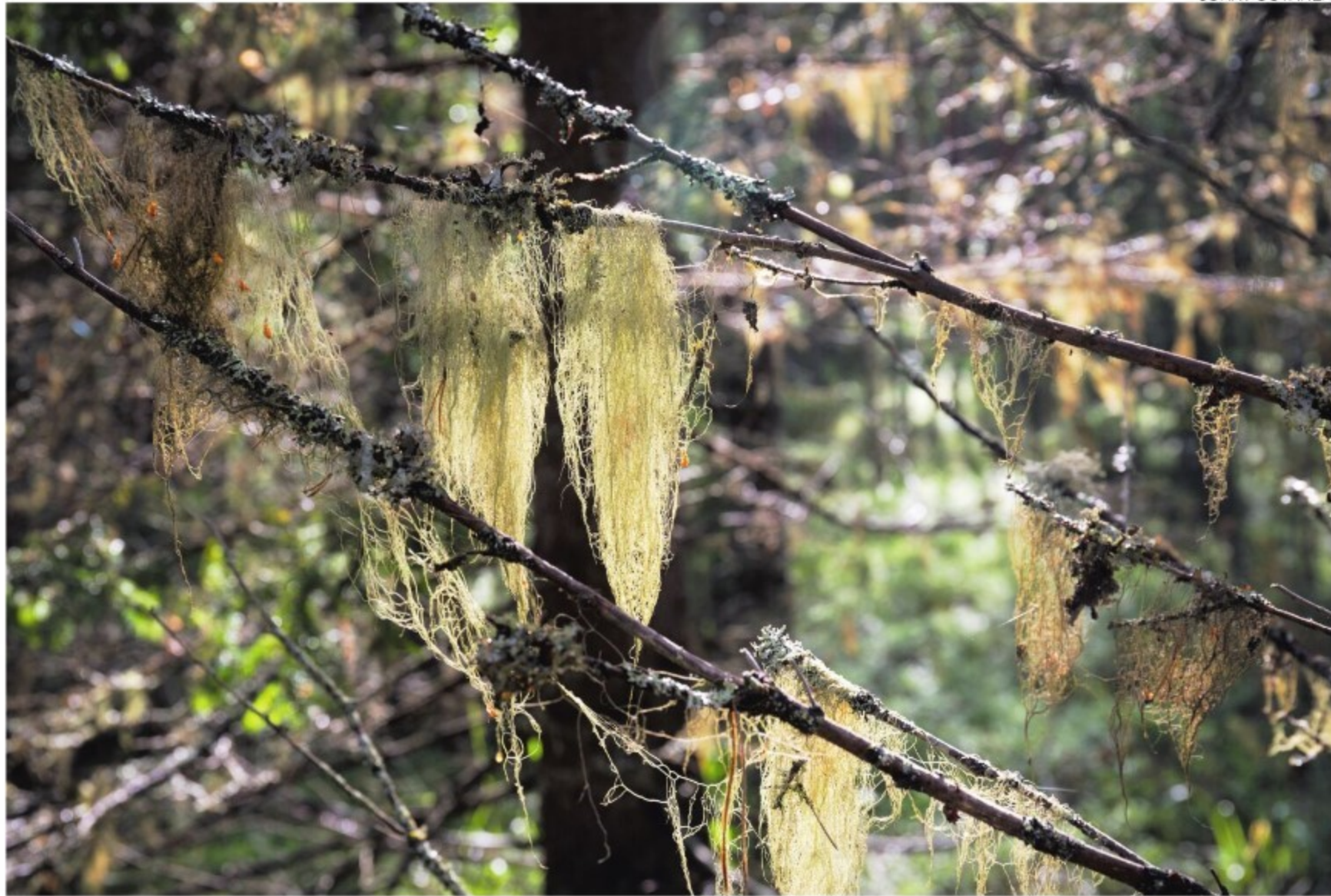
Suojelupinta-alaltaan Pohjois-Savo on takamatkalla kaikkia naapurimaakuntia, Pohjois-Savon metsäneuvostosta kirjoitetaan.

Tällä hetkellä pienistä taimikoista 60 prosenttia on Pohjois-Savossa laadultaan hyviä.