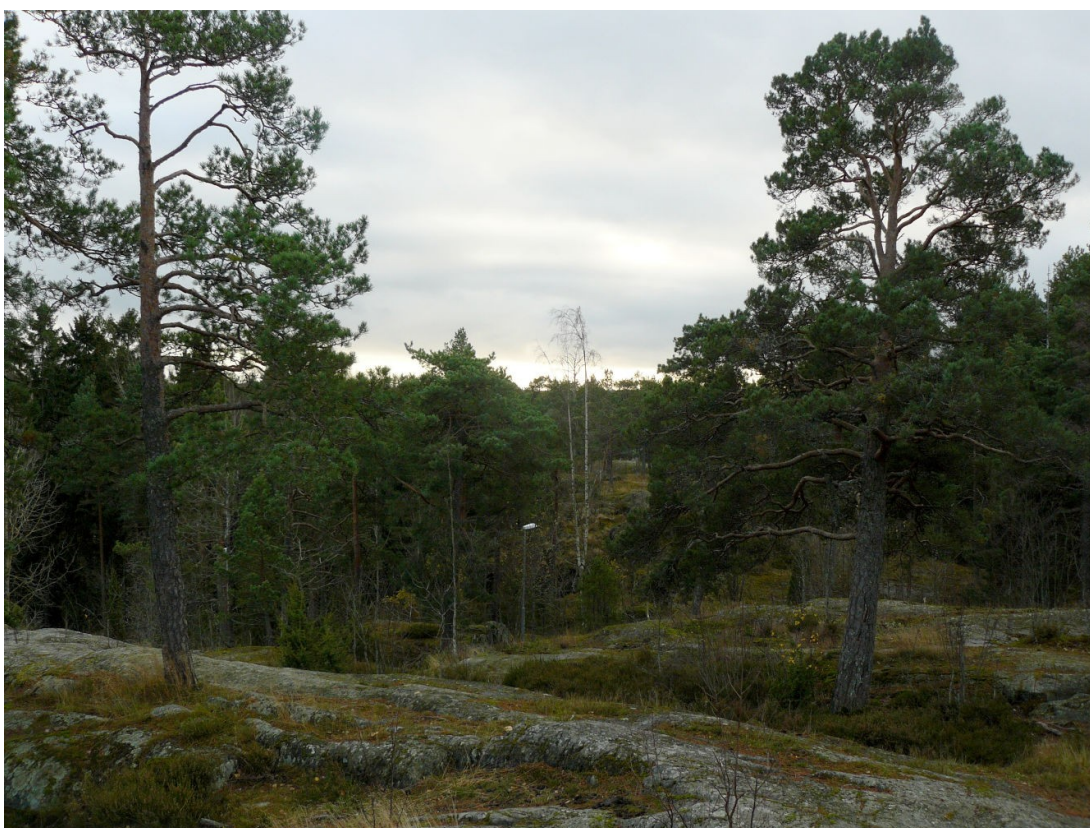
Kuva 4. Näkymä Pohjavedenpuiston korkeimmalta kohdalta lounaaseen. Keskellä lyhtypylväs Pohjavedenpuiston läpi kulkevan itä-länsisuuntaisen kävelytien varrella.