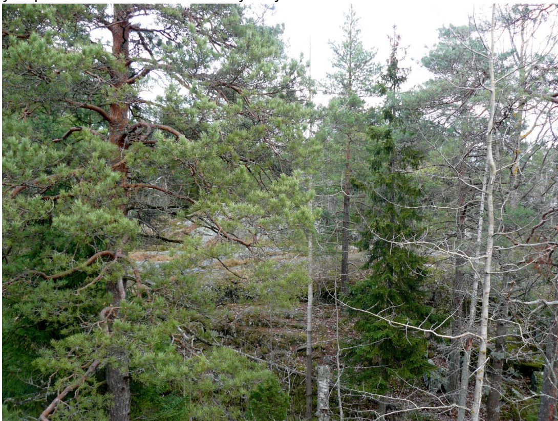
Kuva 3. Näkymä Pohjavedenpuiston korkeimmalta kohdalta koilliseen.

menetetään kaavassa talon alle tontilla 54165 ja nyt julkinen merinäköala jää talon ylimpien kerrosten asukkaiden yksityisomaisuudeksi.