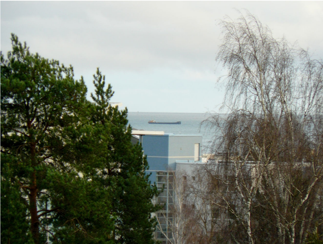
Kuva 1. Merinäköala (zoom) Pohjavedenpuiston korkeimmalta kohdalta Kallahden asuinalueen yli kaakkoon Skatanselälle.