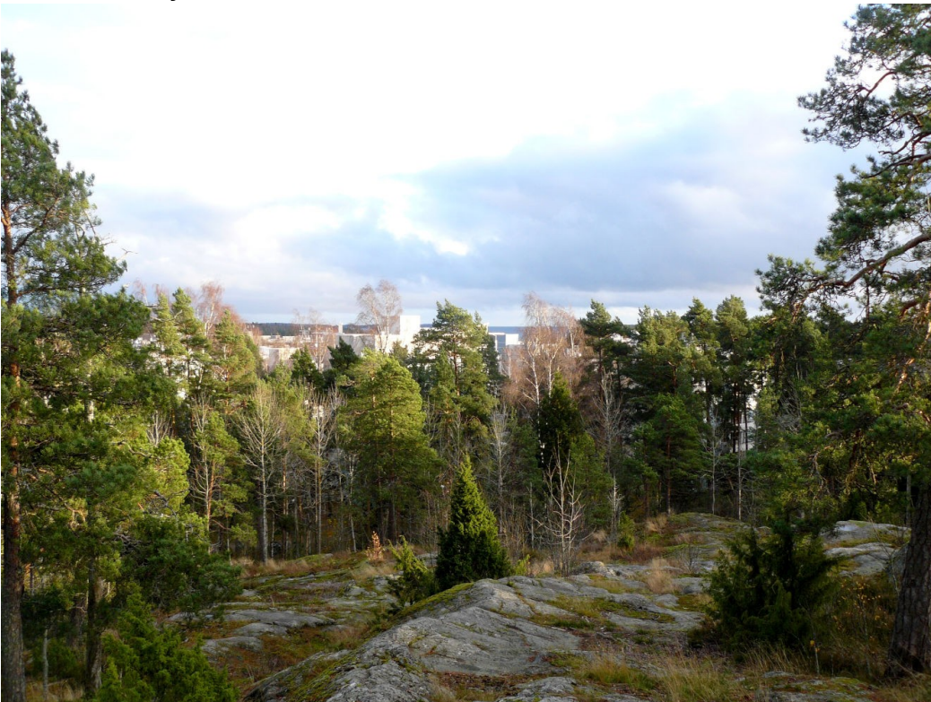
Kuva 2. Näkymä Pohjavedenpuiston korkeimmalta kohdalta (29 m mpy) kaakkoon. Merinäköala Kallahden asuinalueen yli Skatanselälle. Pohjavedenpuiston korkein kohta