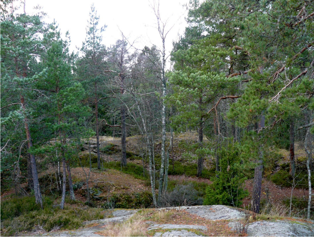
Kuva 5. Näkymä Pohjavedenpuiston korkeimmalta kohdalta luoteeseen.