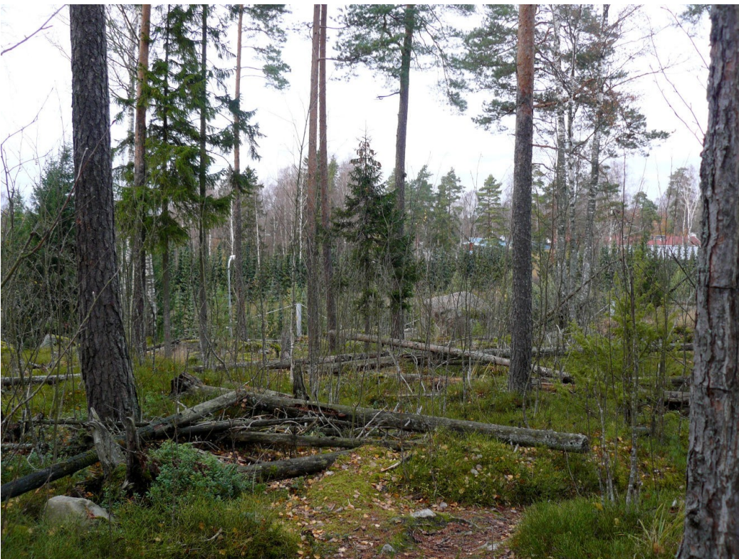
Kuva 6. Näkymä Pohjavedenpuiston pohjoisreunalta pohjoiseen Vuotien yli Rastilaan, keskellä Rastilan puolella Vuotien reunaan istutettu kuusiaita, takana oikealla Rastilan asuintaloja. Kallahti Kallvik ry:n ehdottaman viherkannen paikka pohjois-eteläsuuntaisen metsäverkostoyhteyden eheyttämiseksi Vuotien railon yli Pohjavedenpuistosta Kallvikintien suojametsävyöhykkeelle.