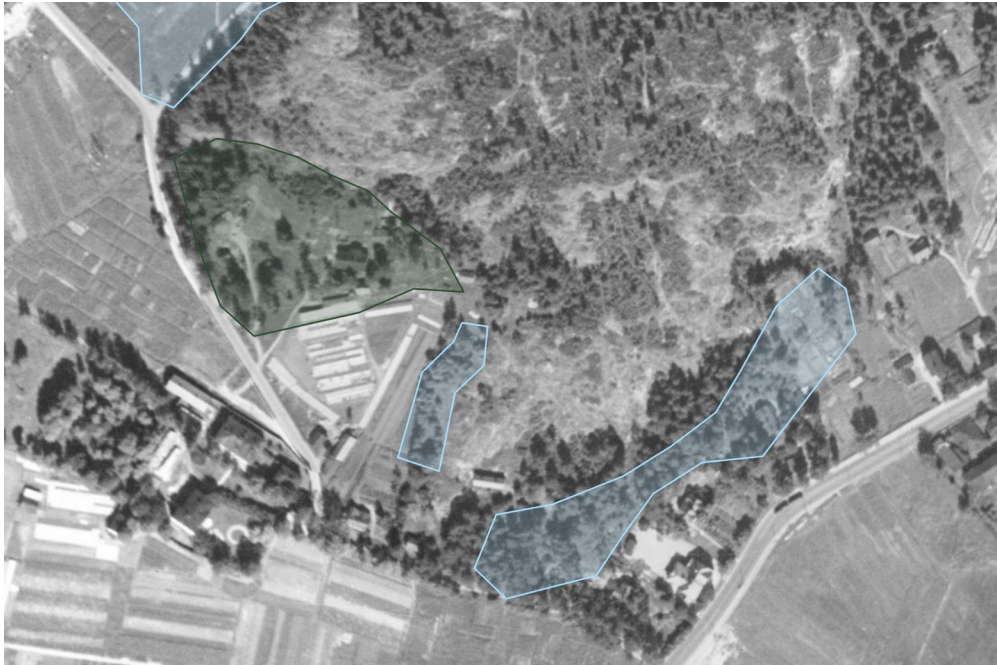
Kuva 2. Kaupungin luontotyyppikartoituksessa tutkitut alueet vuoden 1932 ilmakuvan päällä. Vihertävä rajaus on oikein tulkittu uhanalaiseksi luontotyyppiä. Alue on kuitenkin lähtökohdiltaan vähemmän metsäinen kuin pitkä sininen alue, joka sijoittuu nyt puistotettavaksi ja rakennettavaksi aiotulle alueelle.

ELY-keskusten käytössä on jo uuden luonnonsuojeluasetuksen mukainen inventointiohjeen luonnos: