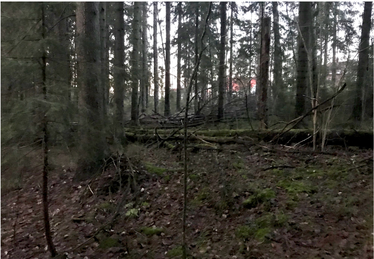
Kortteleiden 267, 269 alle jäävää aluetta länteenpäin kuvattuina, METSO I kangaskorpea, kuva: Laura Räsänen

Kirkkonummen ympäristöyhdistyksen omat sekä Suomen luonnonsuojeluliiton Uudenmaan piirin luontoasiantuntijat ovat 2019 perehtyneet kaava-alueen metsien luonto- ja lajistoarvoihin. Maastokäynnit ovat suuntautuneet pääosin rakennettavaksi kaavailluille alueille. Tehtyjen maastokäyntien havaintojen perusteella on todettava, että kaavan luontoselvityksissä ei ole riittävässä määrin selvitetty tai tunnistettu kaava-alueen metsien keskeisimpiä luontotyyppi- ja lajistoarvoja. Alueen merkitys liito-oraville on tunnistettu selvityksen tilanteen mukaisesti, sen sijaan tunnistamatta on jäänyt alueella säilynyt merkittävä arvokkaiden metsäluontotyyppien keskittymä sekä siihen liittyvät huomattavat lajistoarvot.