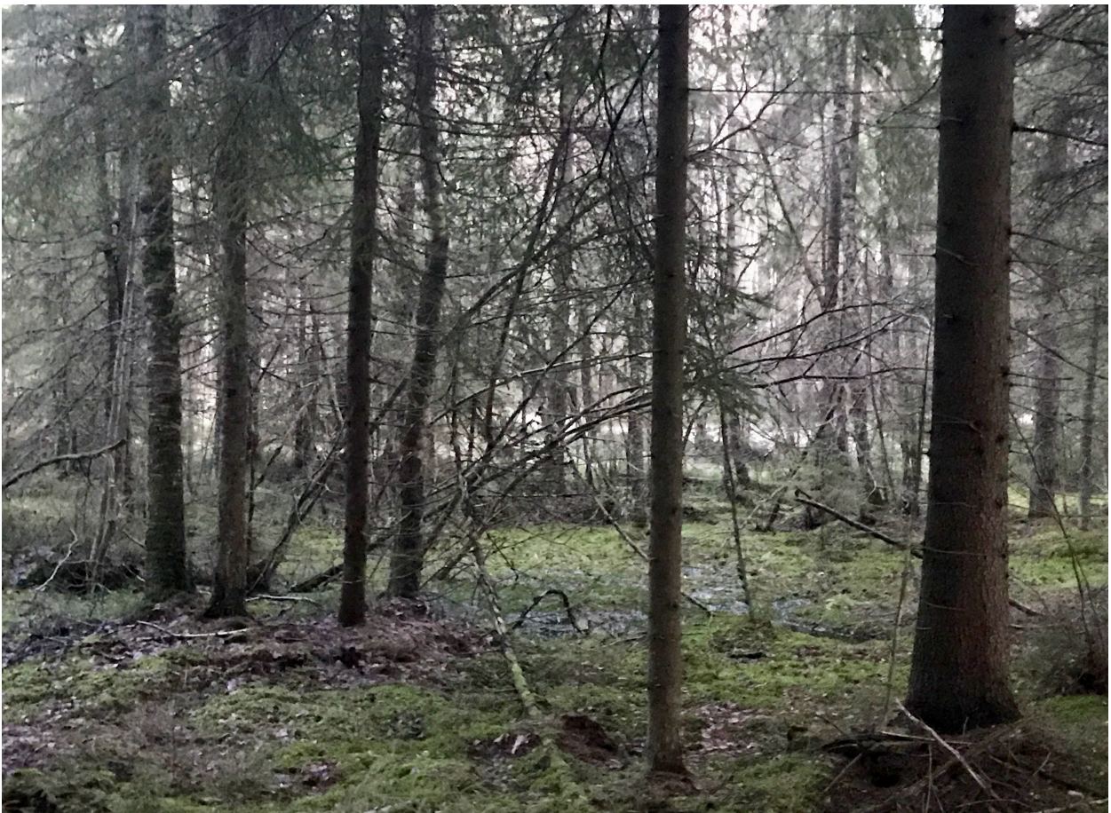
Korpi lounaispuolelta kuvattuna, METSO I korpea

Kaava-alue on keskeinen osa Veikkolan eteläpuolista metsäisten alueiden kokonaisuutta. Sen säilyttäminen rakentamattomana turvaisi osaltaan myös Veikkolan nykyisten ja tulevien asukkaiden tarvitsemat lähivirkistysalueet. Nykyisessä, pitkään ilman metsänhoitoa kehittyneessä tilassa alue tarjoaa ulkoiluun ja luonnontarkkailuun luonnontilaisemman vaihtoehdon kuin Veikkolan urheilupuisto, joka on pirstottu metsänhakuilla ja frisbeegolfradalla sekä useilla ulkoluteilla.