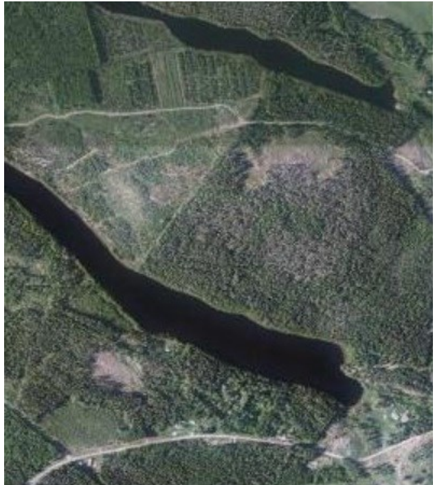
Vasen kuva: Asuman alueelle suunnitellut hakkuukuviot ja -tavat. Oikea kuva: Ilmakuva-alueesta