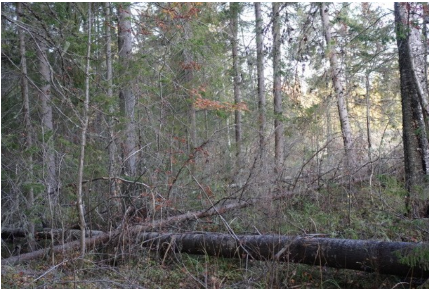
Yllä olevat kuvat kuviolta 722.