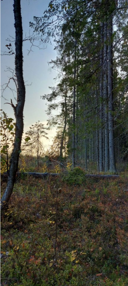
Kuvio 722 rajautuu aiemmin suoritettuun avohakkuualueeseen.