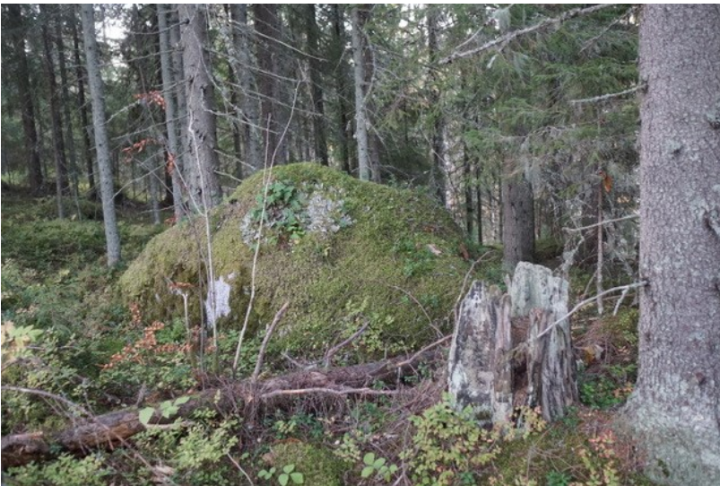
Myös kuvio 700 (kuva yllä) on luonnontilaisen kaltainen.