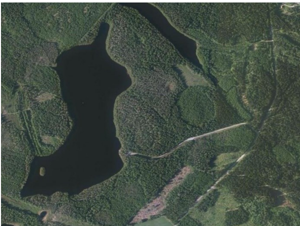
Kuva 2. Ilmakuva Suuri Petäisen alueesta