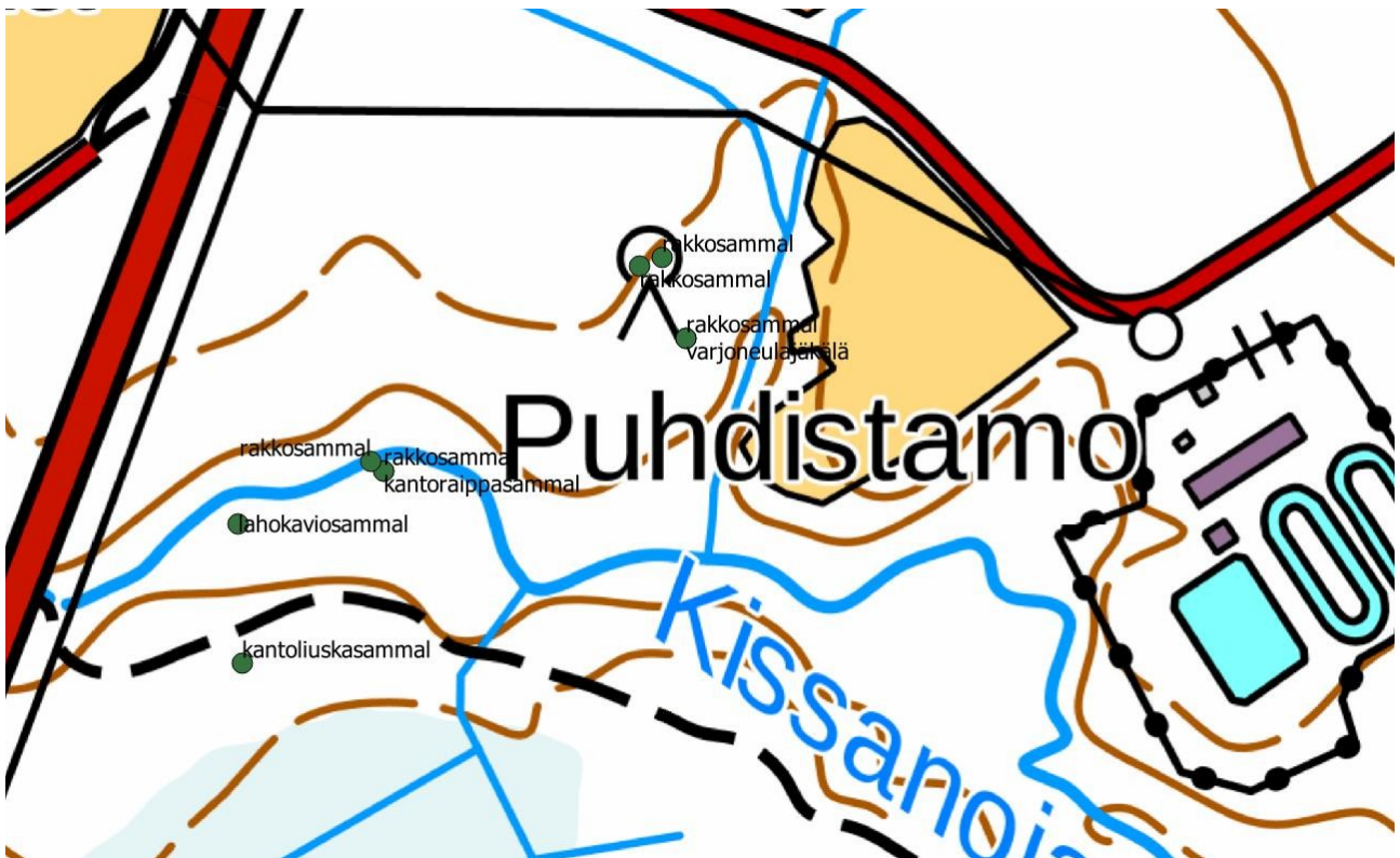
Liite 1. Kissanojalta havaitut luontoarvoja indikoivat sammalet ja jäkälät. Lajeista lahokaviosammal on luokiteltu äärimmäisen uhanalaiseksi ja rakkosammal sekä kantoraippasammal valtakunnallisesti silmälläpidettäviksi ja alueellisesti uhanalaisiksi lajeiksi. Lahokaviosammal on lisäksi luonnonsuojelulain 49 § suojaama laji.