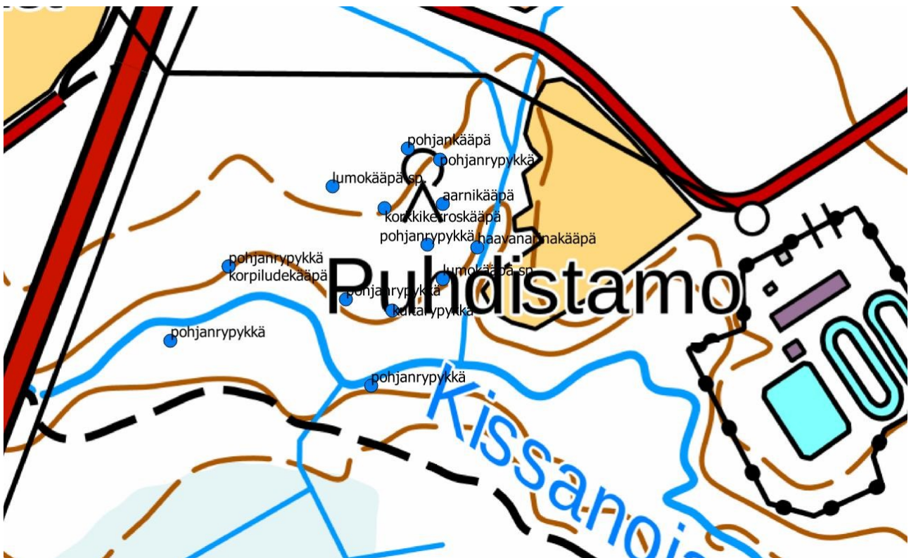
Liite 2. Kissanojalta havaitut luontoarvoja indikoivat kääväksälajit (lajit 1-8). Lajeista korkkikerroskääpä, korpiludekääpä, lumokääpä ja pohjanrypykkä ovat kaikki valtakunnallisesti silmälläpidettäviä, kolme viimeksi mainittua ovat lisäksi alueellisesti uhanalaisia lohkona 2a.