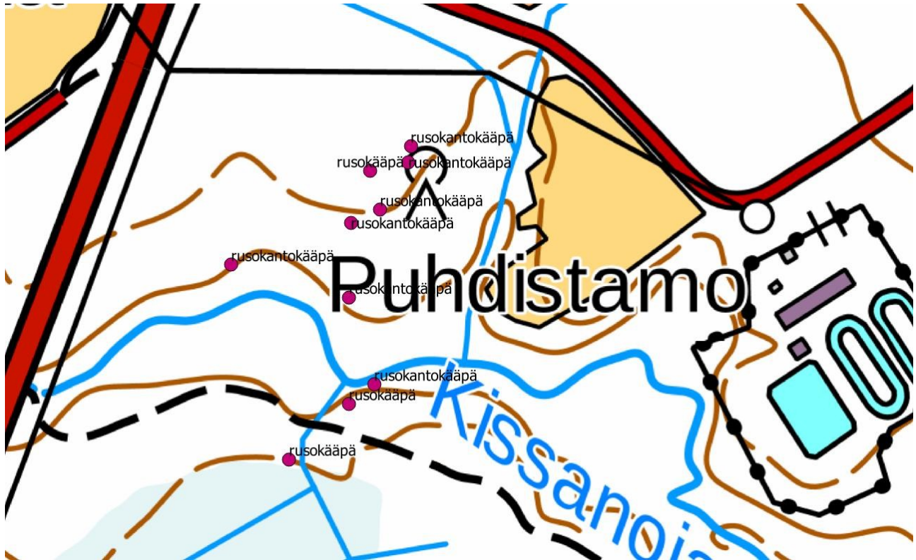
Liite 4. Kissanojalta havaitut luontoarvoja indikoivat kääpälajit (lajit 12-13). Lajeista rusokantokääpä on valtakunnallisesti silmälläpidettävä laji, joka on samalla alueellisesti uhanalainen lohkokalla 2a.