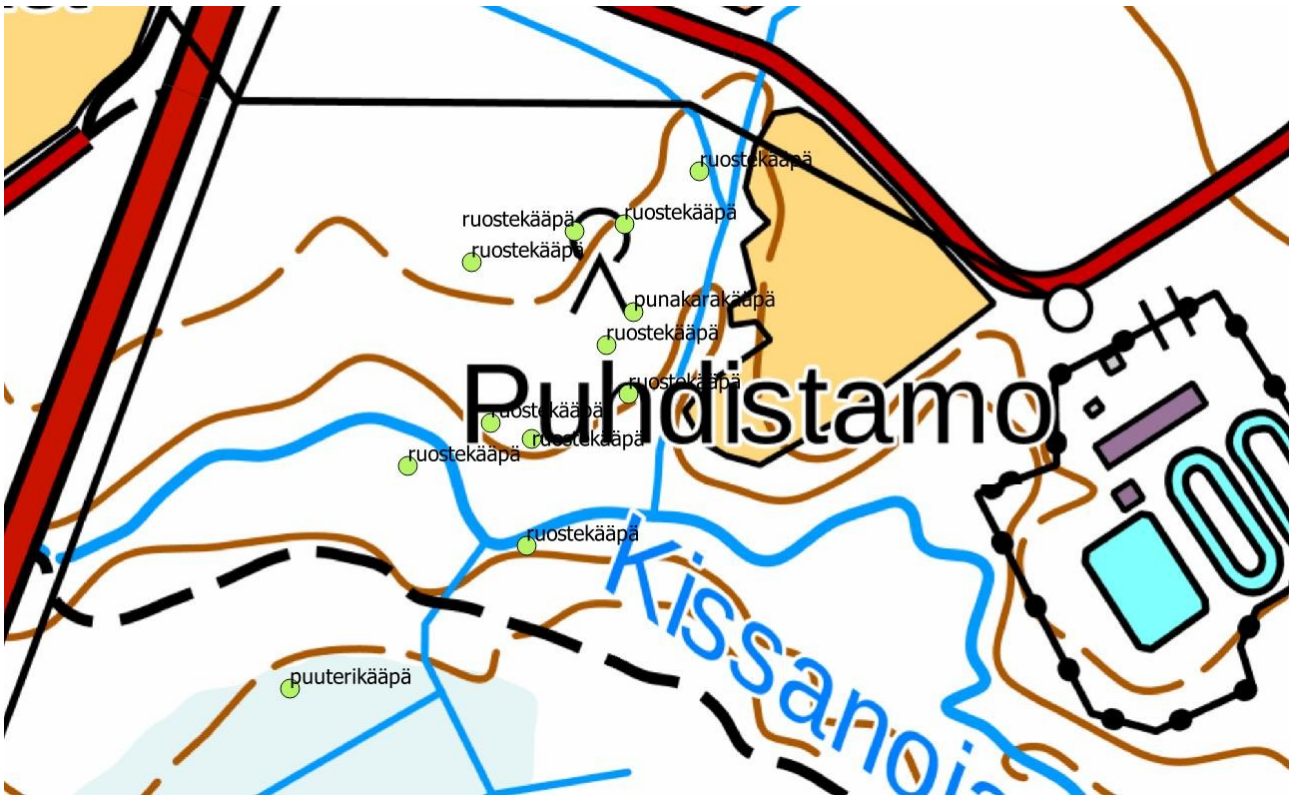
Liite 3. Kissanojalta havaitut luontoarvoja indikoivat kääpälajit (lajit 9-11). Lajeista punakarakääpä on valtakunnallisesti silmälläpidettävä laji, joka on samalla alueellisesti uhanalainen lohkokalla 2a.