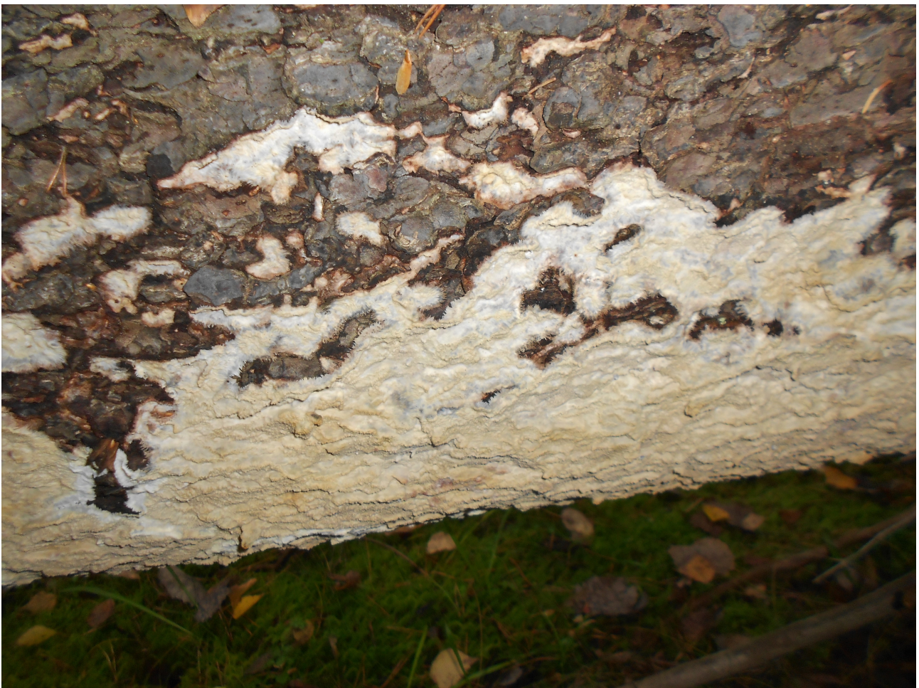
Vaateliaan pohjarypykän vankka paikalliskanta Kissanojan vanhassa metsässä on kytköksissä metsän erinomaiseen kuusilahopuujaatkumoon, joka näkyy selvästi muussakin lajistossa.

Alueelta havaittu luontoarvoja indikoiva lajisto on esitetty muistion liitekartoilla 1-4.