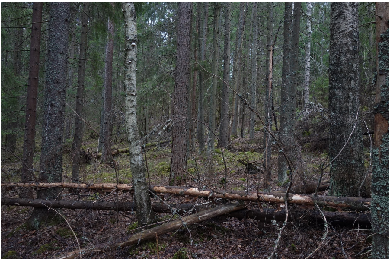
Toreenin metsäalueen itäosan puustoltaan luonnontilaisen kaltaista ja runsalahoppuustoista, edustavuusluokan I METSO-kangasmetsää.

Läntisin maastokäynnillä pinnallisesti tarkasteltu palsta (543-402-32-112) on luonteeltaan pääosin edellisen palstan kaltainen, mutta puustossa on enemmän järeää haapaa ja palstan pohjoisosan kasvillisuus lähenee jo keskiravinteista tuoretta lehtoa (OMaT). Merkittävästi haapaa on myös peltoalueen reunametsässä (palsta 543-402-32-2).