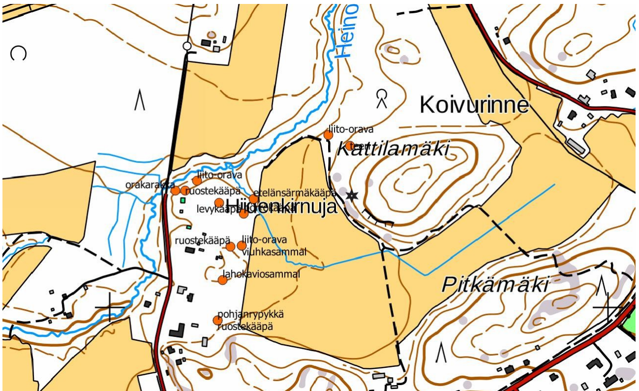
Liite 5. Heinojalta havaitut luontoarvoja indikoivat lajit sekä liito-oravan ja teeren jätöspuut. Lajeista lahokaviosammal on luokiteltu äärimmäisen uhanalaiseksi, pohjanryppykkä alueellisesti uhanalaiseksi ja liito-orava silmälläpidettäväksi. Lahokaviosammal on lisäksi ls-lain 49 § ja liito-orava ls-lain 47 § suojaama laji.