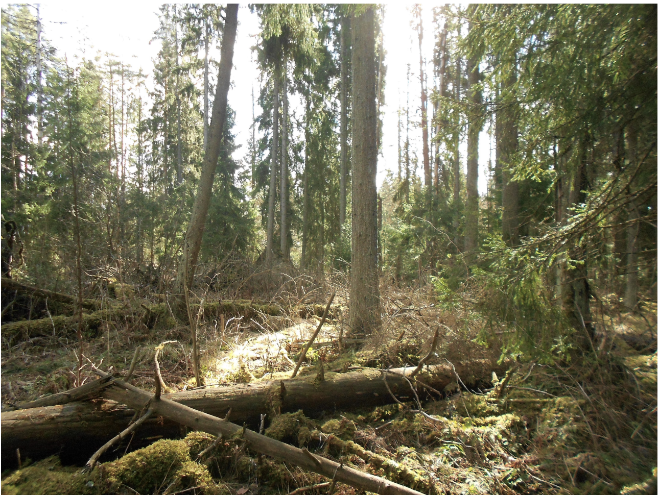
Kissanojan vanhan metsän ydinosassa vallitsee Keski-Uudenmaan oloissa poikkeuksellisen hyvä kuusilahopuujatkumo, mikä näkyy suoraan myös alueen lajistossa.

Kissanojan pohjoispuolinen noin kahden hehtaarin laajuinen iäkäs metsä on Keski-Uudenmaan oloissa poikkeuksellisen arvokas. Tehdyssä luontoselvityksessä (Ramboll 2014) metsän väitetään olevan varttunutta (eli metsää, joka ei vielä ole saavuttanut minimi-ikää tai -läpimittaa, jossa talousmetsä tavallisesti käsitellään avo- tai siemenpuuhakkuulla), metsänhakuilla käsiteltyä ja lehtomaista kangasta. Näistä väitteistä vain viimeisin pitää paikkansa ja sekin vain osin.