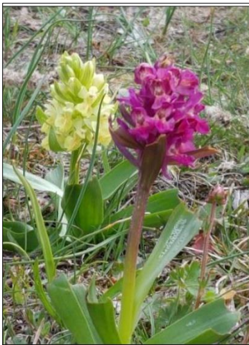
Seljakämmekä, "Adam och Eve"

Hinta määräytyy osallistujamäärän mukaan, yhdistys maksaa osan retkestä.