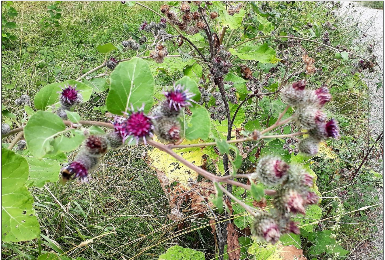
30.7.2021 Takaiset 'taiteilevat' Raisionjoen rannalla.