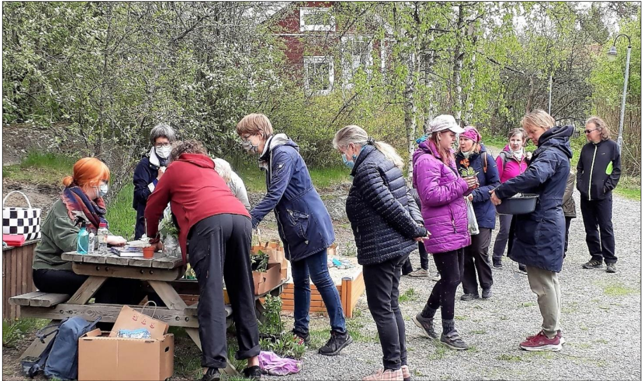
Pihatapahtumassa 16.5.2021 kasvit vaihtoivat omistajaa.

Taito Varsinais-Suomi, Raision Taitokeskus on tapahtuman aikana avoinna. Taitokeskuksessa on esillä värjäyksen esittelyä. Sieltä voi myös ostaa käsitöitä.