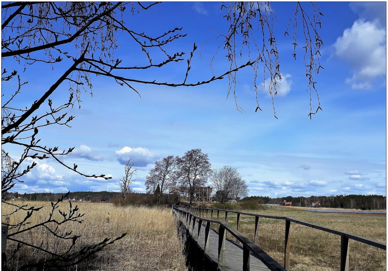
'Polku' lintutornille, kuvattu 28.4.2021

Tervetuloa kaikki linnuista kiinnostuneet!