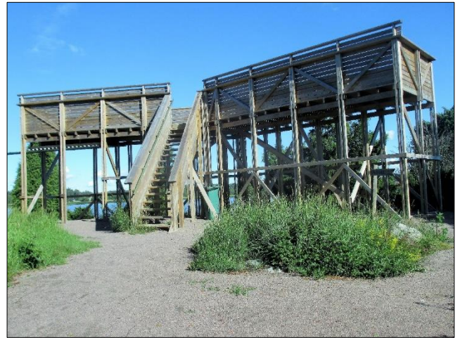
Raisionlahden lintutorni 14.7.2020

Kaiteet on suunniteltu siten, että myös alakouluikäiset lapset voivat tarkkailla lintuja turvallisesti.