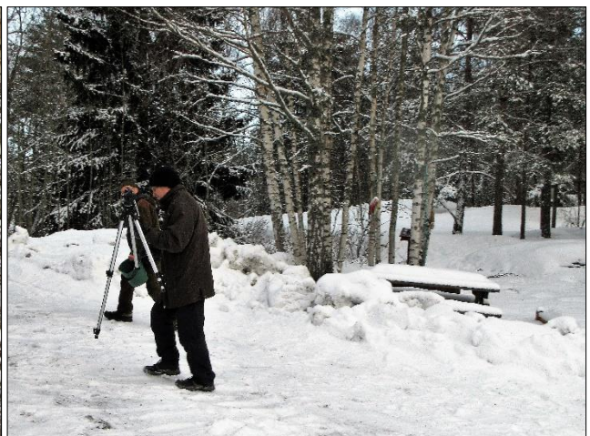
Kuvat 31.1.2021 pihabongaus tapahtumasta – Friisilässä.