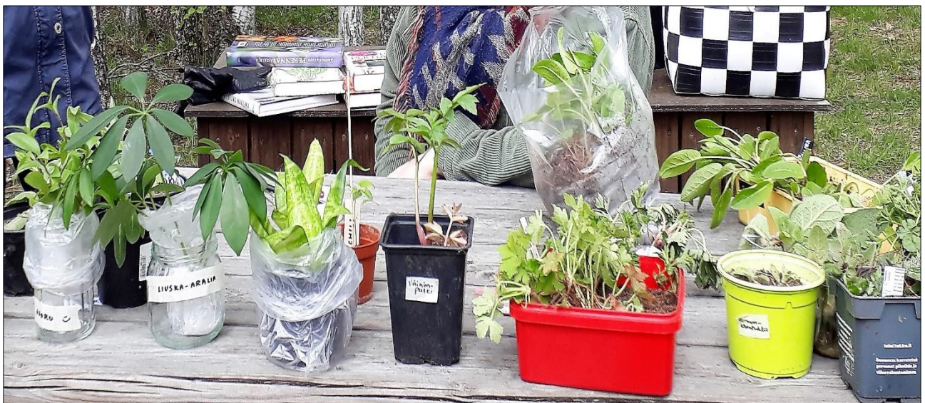
Kasvien vaihtopöydän 'tarjontaa' 16.5.2021 pihatapahtumassa.