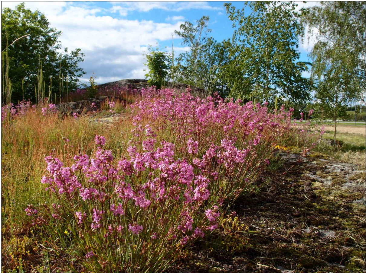
Mäkitervakkokasvustoa Raision kaupungintalon takana. Tutustumme myös viereisen joutomaan yleisimpiin kasvilajeihin.

Tahmeasta eritteestä on etua kasville siinäkin mielessä, että harva halua poimia kesäisen kukkakimpun näistä kauniista kukista, kun seurauksena voi olla likaiset kädet ja roskaiset kukkavarret maljakossa.