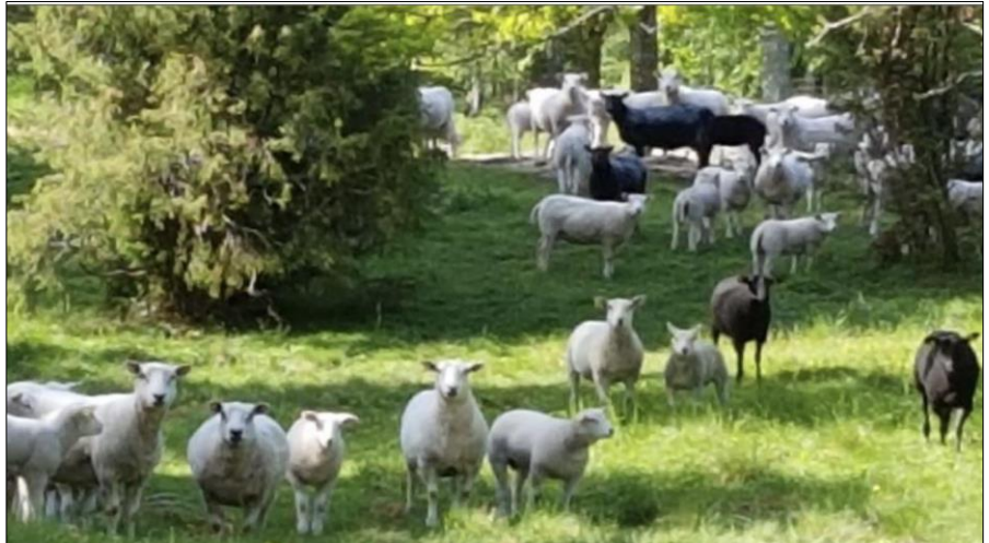
Lampaitakin varmasti nähdään matkalla

Seuraa päivittyvää ilmoittelua yhdistyksen verkkosivuilla!