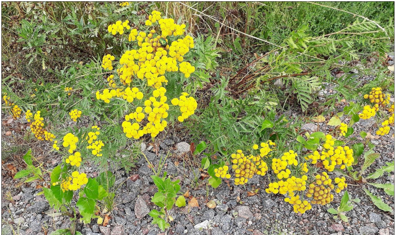
30.7.2021 Pietaryrtit loistavat keltaisina Raisionjoen rannan tuntumassa.