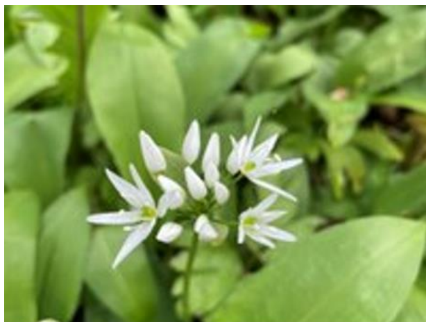
Ramsholmenin polku ja karhunlaukka, ramslök