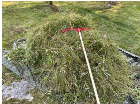
Haravoitavaa kertyi aikamoiset kasat