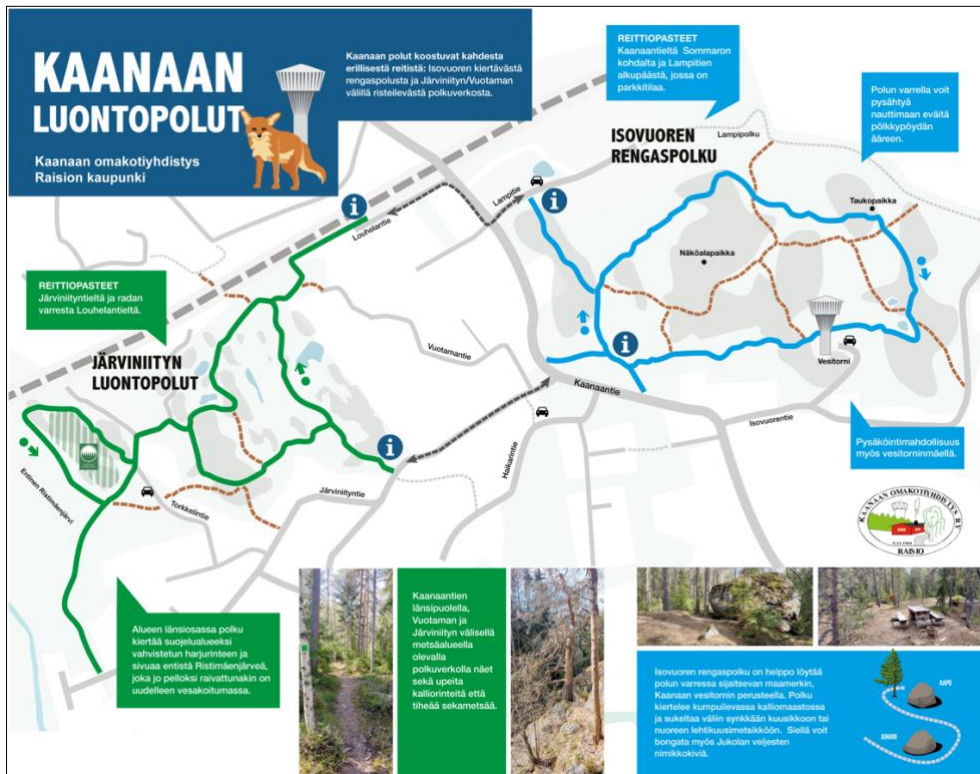
Kartta löytyy Kaanaan Omakotiyhdistyksen sivuilta

Mukaan lähtee opas omakotiyhdistyksestä. Innokkaimmat voivat kiertää myös Järviiniityn polut. Sopiva vaatetus ja omat eväät tarpeen mukaan!