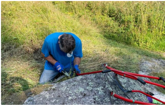
Viikatteet vaativat välillä teroittamista