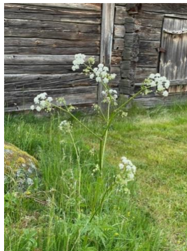
Kastelholman linna ja Jan Karlsgårdenin tunnelmaa