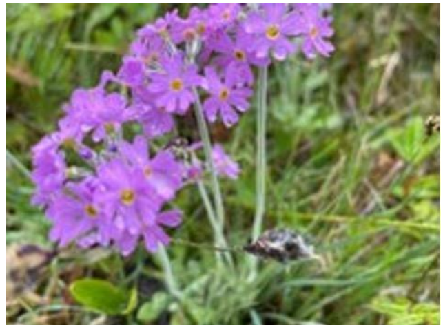
Miehenkämmekkä ja jauhoesikko

Posti- ja tullitalolta kävelimme luontopolkua pitkin Ahvenanmaan metsästys- ja kalastusmuseolle. Tämä lyhyt matka vei meidät aidatun alueen ohi, jossa edelleen elelee saksanhirviä eli isokauriita sekä villisikoja, joita molempia tuotiin Ahvenanmaalle 1400-1500-luvulla riistaeläimiksi. Pari saksanhirveä näimmekin aidan takaa. Metsästys- ja kalastusmuseoon emme ehtineet aikataulun vuoksi tutustua juuri julkisivua ja museokauppaa enempää, mutta rakennus ja koko ympäristö olivat