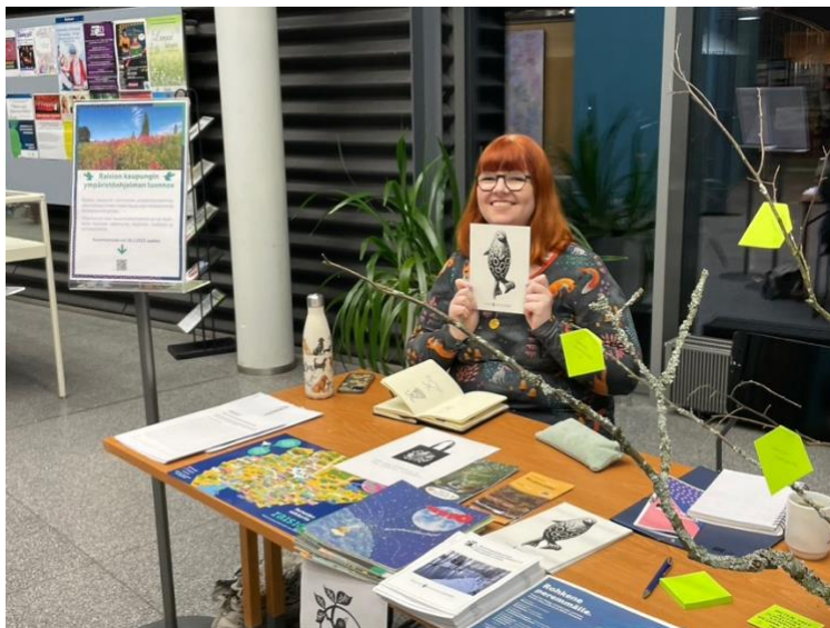
Luonto lainassa – viikolla helmikuussa esiteltiin yhdistyksen toimintaa Raision kirjastossa