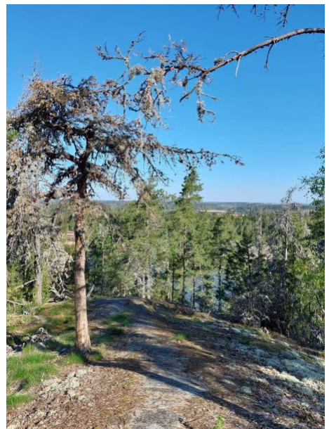
Kuvat Nunnavuorelta