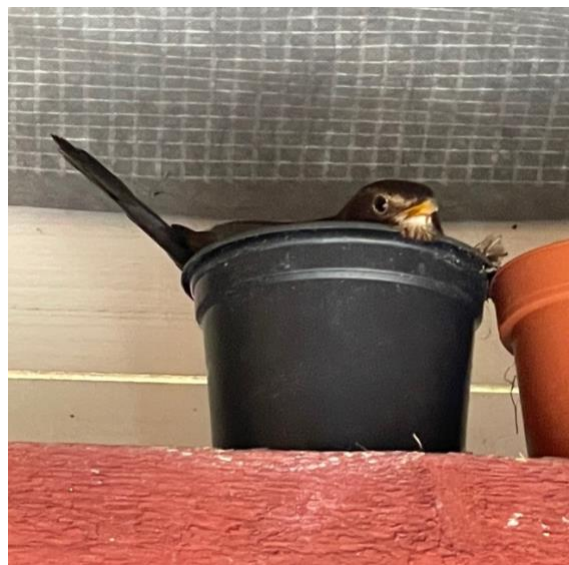
Mustarastaan pesimäpuuhia – yksi pesue haudottiin kukkaruukussa!