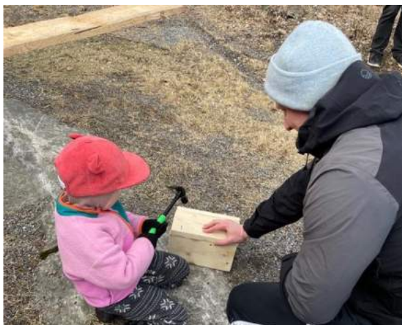
Nuori innokas pöntöntekijä vauhdissa.

Perinteiset pönttötalkoot pidettiin jälleen Friisilän pihapiirissä. Koteja valmistui eri lajeille useita.