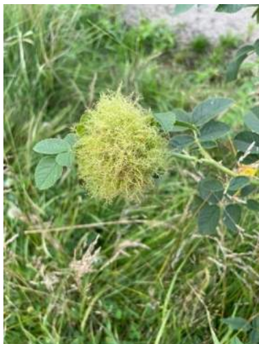
Takkuäkämäpistäisen toukat ovat ärsyttäneet ruusun silmun kasvamaan palloksi