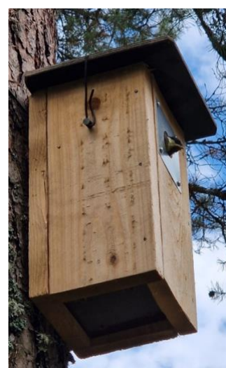
Talitiaisen poikanen lähdössä maailmalle