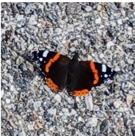
Amiraaliperhonen, kuvattu Ruskon kirkon pihalla (Tuula Lundén)