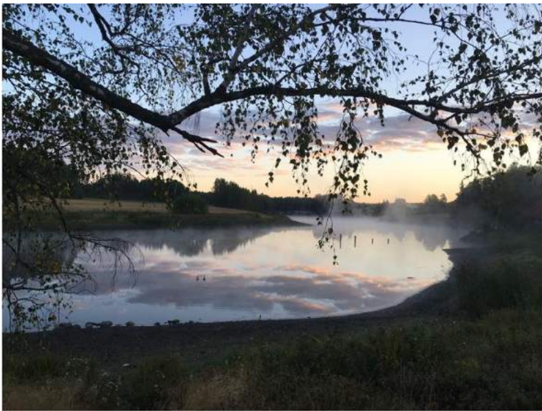
Raisionjoki – Ruskonjoki – Vahdonjoki

Tervetuloa siis mukaan tapahtumiin tai ottamaan yhteyttä: lsy@raisionjoki.fi