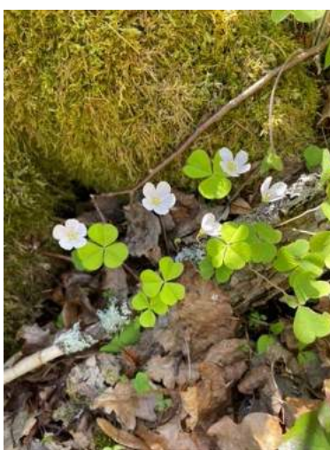
Ketunleipä vai käenkaali?