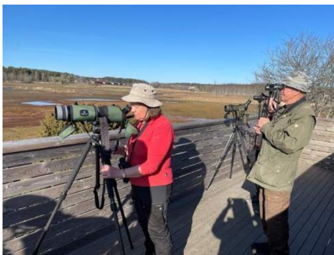
Lintubongareita Raisionlahden lintutornilla