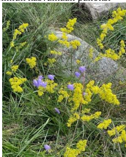
Keltamatarra ja kissankello