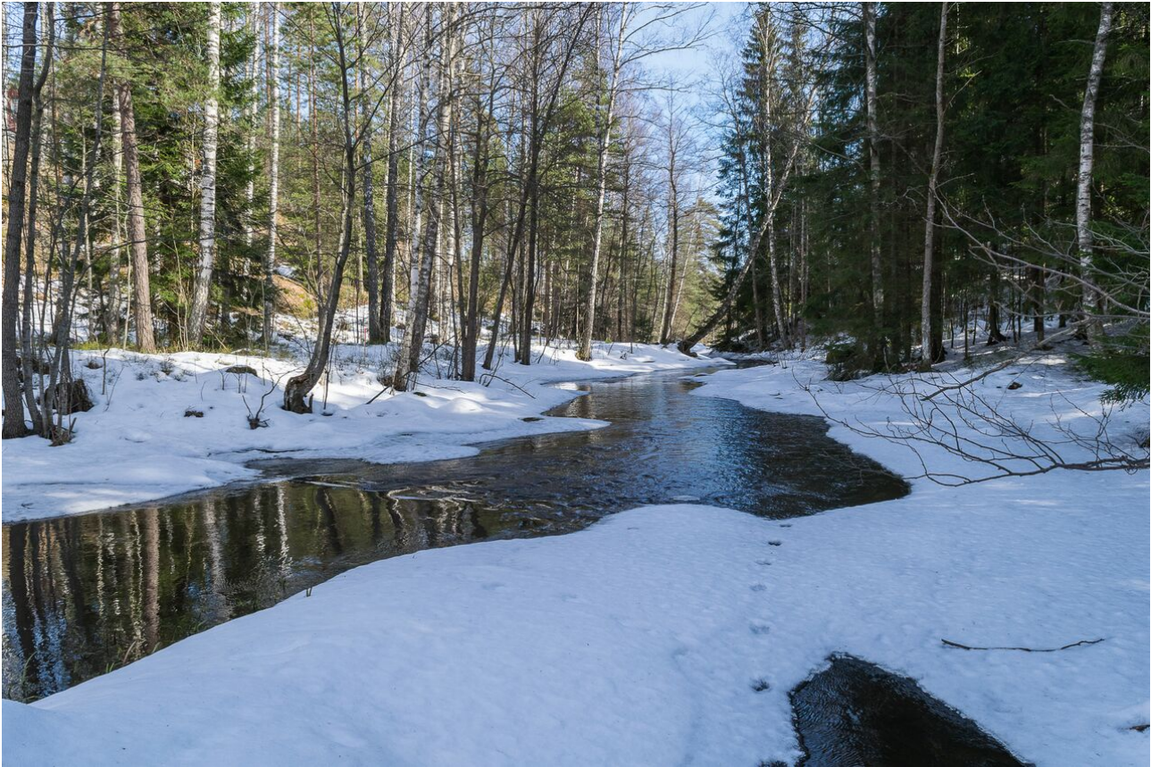
Mynttilän Stampforsenin virtavesi Kvarnträsketin ja Dämmanin välissä.

20. Mynttilän metsä eli Högaberget Kvarnträsketin ja Dämmanin eteläpuolella sisältää Mynttilän alueen luonnonsuojelullisesti merkittävimmän luontoalueen (Pohjoiset Arvometsät -esityksen kohde nro 37). Alueelle esitetään juna-asemaa sekä siihen tukeutuvaa tehokasta rakentamista. Esitetty tehokas rakentaminen on laajennettu myös Kvarnträsketin eteläpuoliselle alueelle, joka on maakuntakaavassa valkoista aluetta (ja jossa on osoitettu kulkemaan myös itälänsisuuntainen maakunnallinen viheryhteystarve). Mynttilän asemavaraus tulee poistaa ja osoittaa alueen metsät osin SL-varauksena ja osin virkistysalueena.