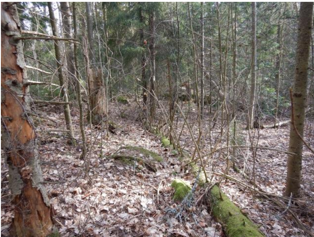
Vanhapuustoista, lahoppuustoista lehtoa ja lehtomaista kangasta, joka jäisi ulkoilureitin alle ja siistimisen piiriin Träskändan luonnonsuojelualueella.