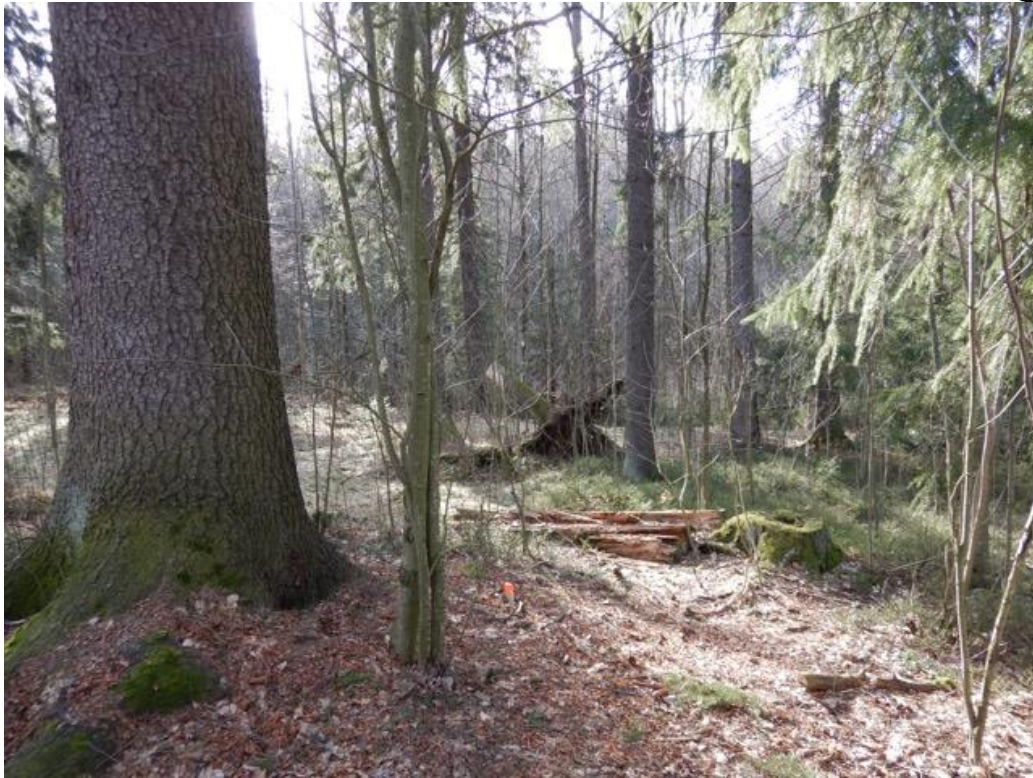
Teknisen keskuksen kaavaileman reitin pohjoispää Träskändan luonnonsuojelualueella. Merkkikeppi on jo 29.3. 2020 valtavan kuusen juurella osoittamassa raivattavaa metsää.