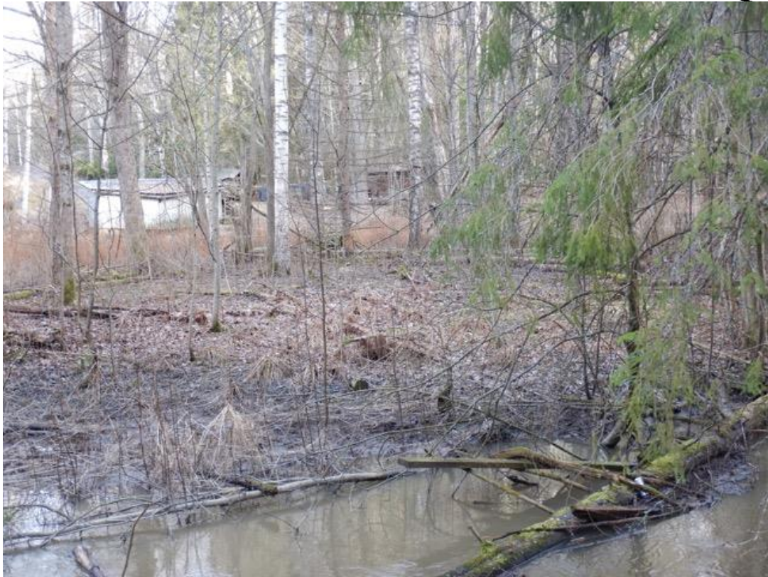
Glimsinjoen kosteaa jokivartta. Näkymä etelärannalta pohjoisrannalle, jossa väylä kulkisi osittain tontin ja joen välisellä kapeahkolla kaistaleella.