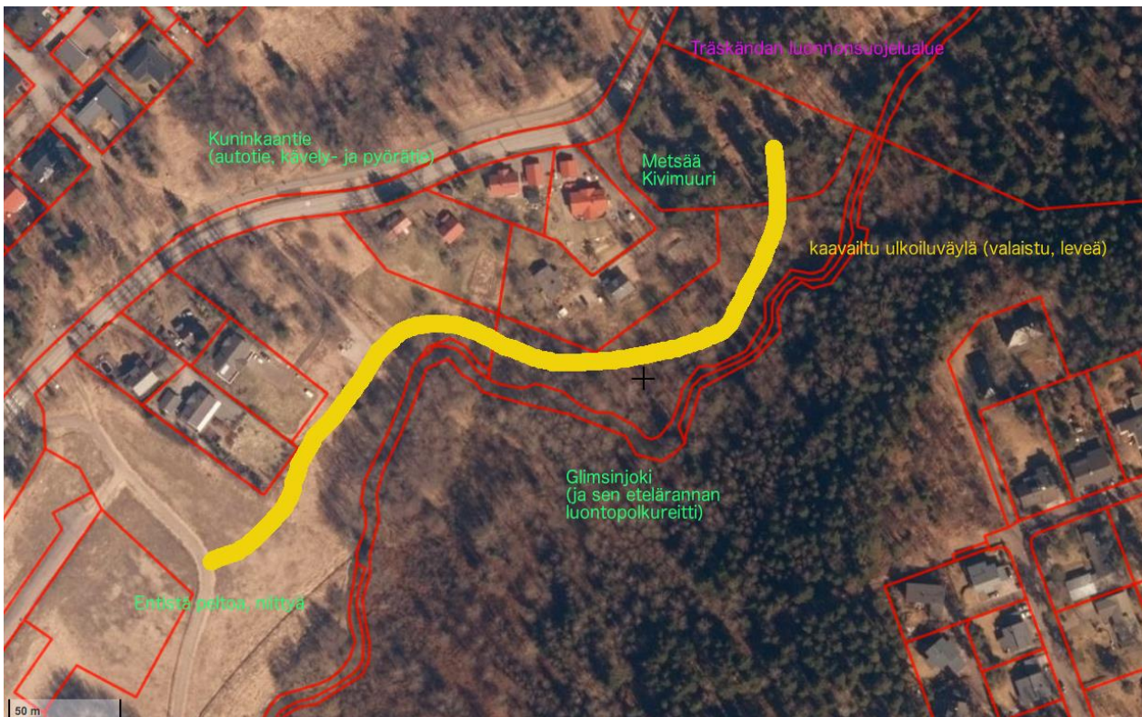
Glimsinjoen yläjuoksulle suunniteltu ulkoilureittiosuus merkittynä keltaisella

Träskändan luonnonsuojelualue on perustettu 1950-luvulla ja sen maasto on nykyään vanhapuustoista ja rehevää jokivarsimetsää, lehtomaista kangasta ja lehtoa. Puustossa on vanhoja kuusia, lehtipuita, mukaan lukien jalopuita, sekä järeää havu- ja lehtilahopuuta. Kuviolla on merkittäviä metsäisiä luonnonarvoja.