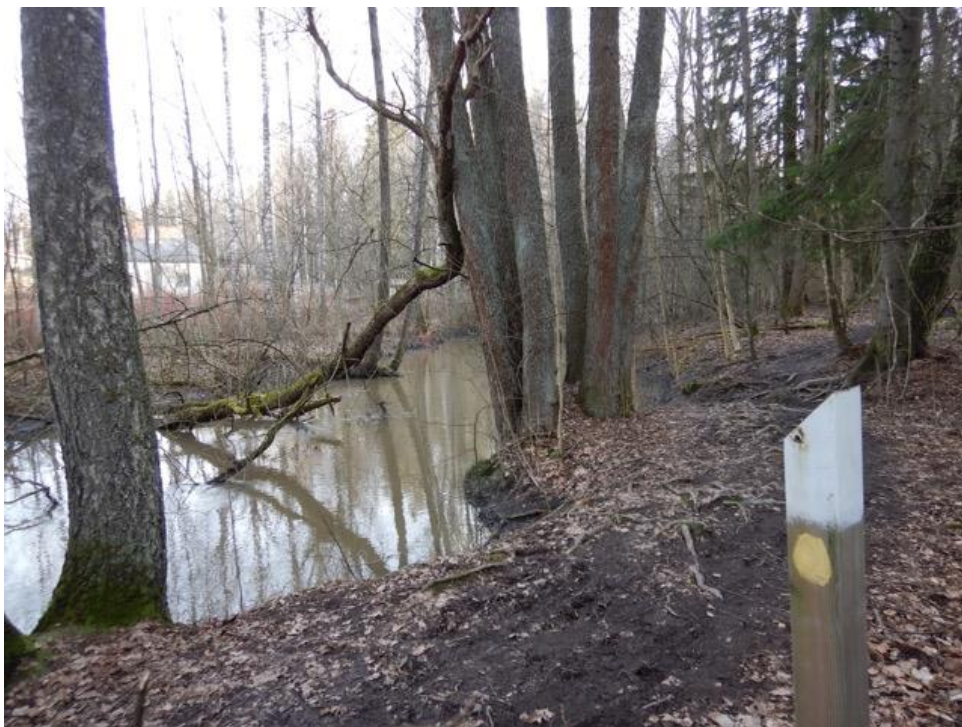
Näkymä joen eteläpuolelta, luontopolkureitiltä, vastarannalle jonne tekninen keskus suunnittelee väylää.