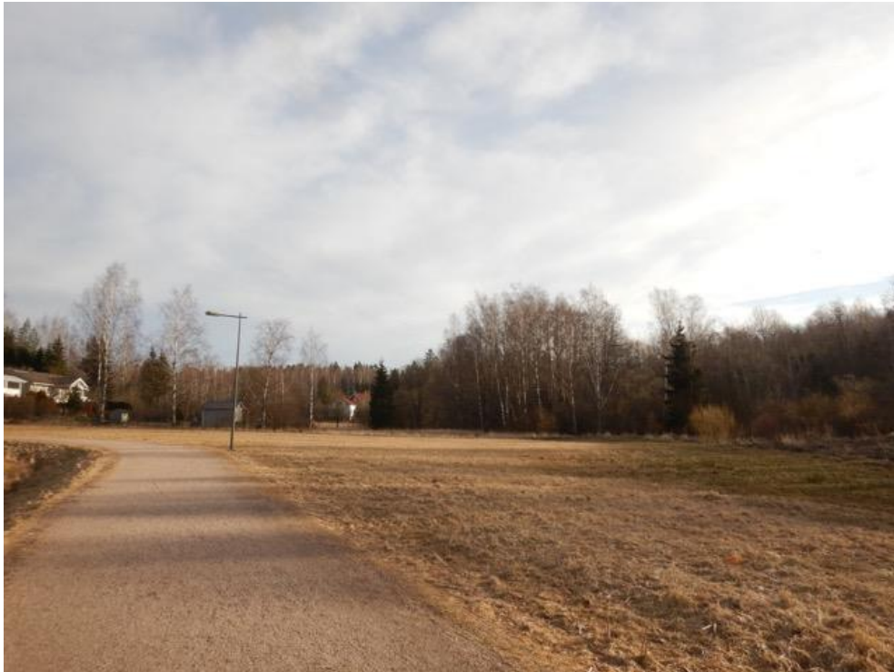
Myllykylän peltoa, väylä lähtisi mutkasta kohti kaukaisuudessa näkyvää valkoista talonseinää. Entisellä pellolla väylästä ei ole ympäristölle merkittävää haittaa.