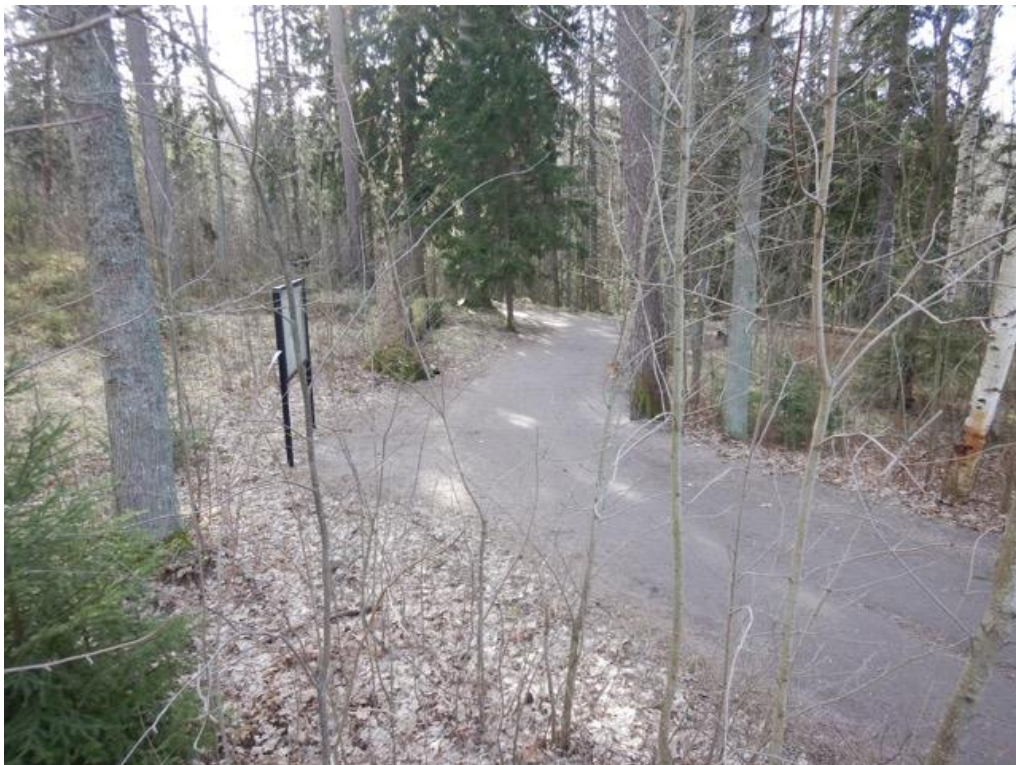
Teknisen keskuksen kaavaileman reitin pohjoispää Träskändan luonnonsuojelualueella. Uusi reitti lähtisi mutkasta oikealle, puhkaisten metsään aukileen.